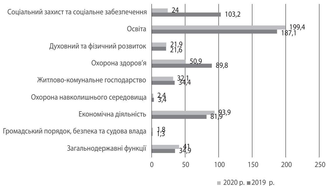
Рис. 1. Видатки місцевих бюджетів за функціями (загальний і спеціальний фонди), млрд грн