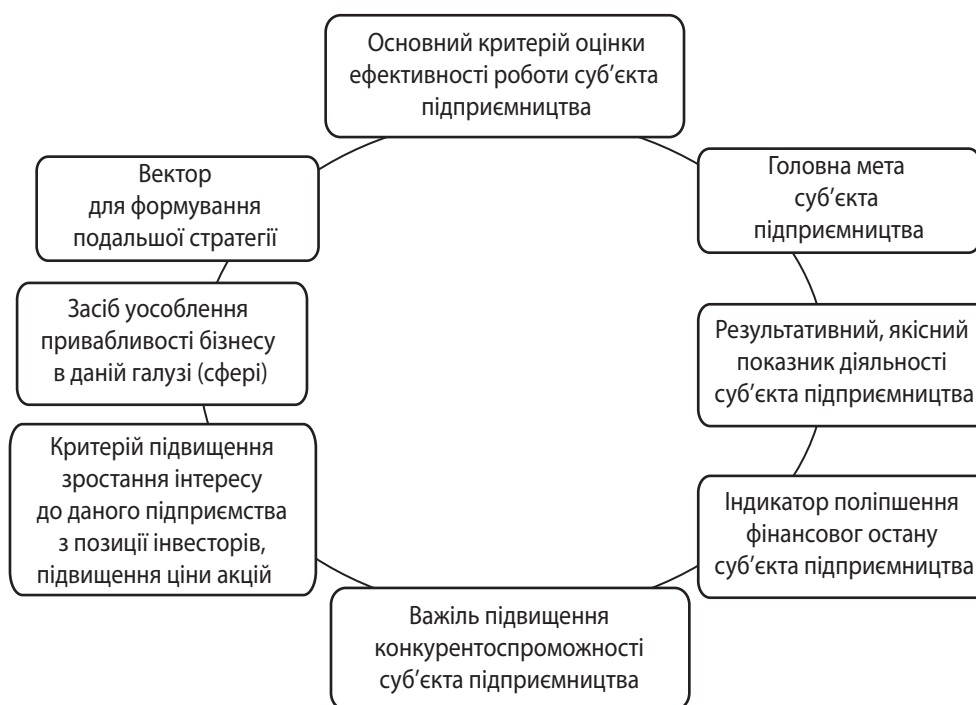
Рис. 2. Якісні критерії показників рентабельності для суб'єктів господарювання регіону