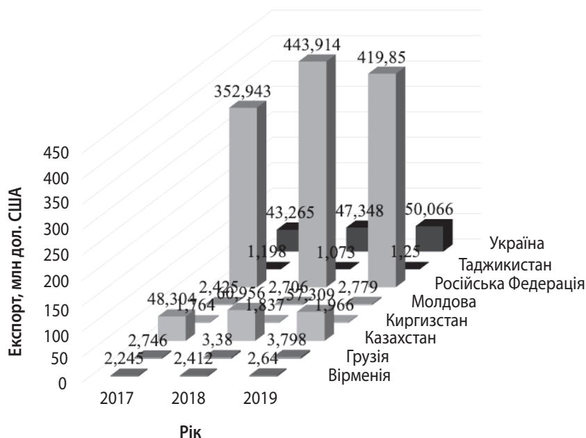
Рис. 1. Експорт товарів країн СНГ, які є учасниками СОТ (млн дол. США)