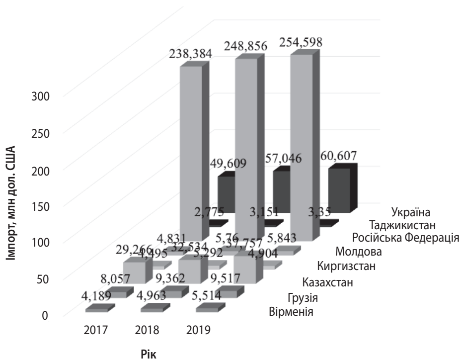
Рис. 2. Імпорт товарів країн СНГ, які є учасниками СОТ (млн дол. США)

2019 р. 13 санітарних і фітосанітарних заходів, така сама тенденція характерна і для Молдови (темپ приросту становив 157,14%). У Російській Федерації, що є лідером впровадження санітарних і фітосанітарних заходів, спостерігається їх зростання на 25%, також можна констатувати збільшення кількості технічних бар'єрів для торгівлі на 19,32% у 2019 р. по відношенню до 2017 р.