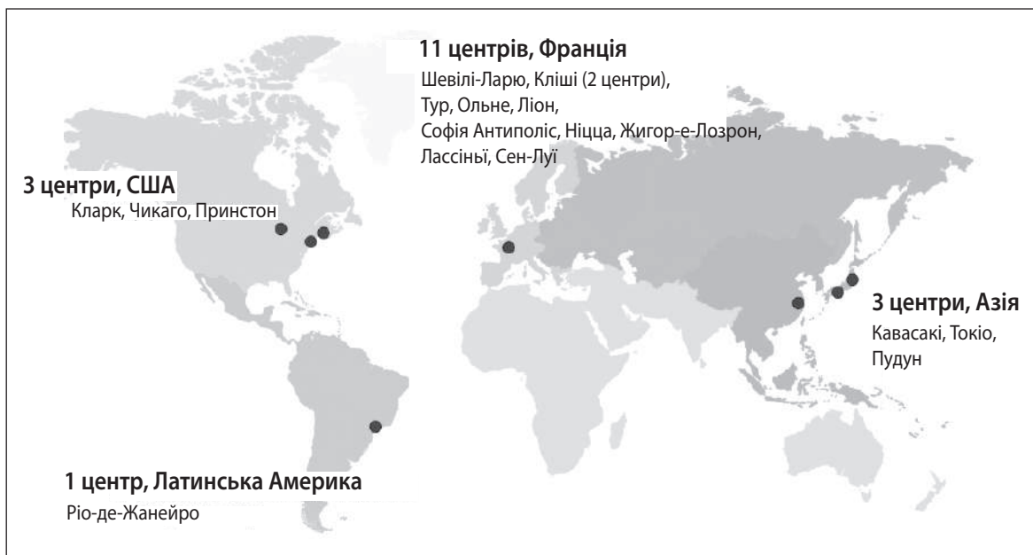
Рис. 1. Найбільші науково-дослідницькі центри компанії L'Oréal Group [12]

інноваційні дослідження (тканинної інженерії, декодування геному людини тощо). Спираючись на розмаїтість команд L'Oréal Group, багатство та взаємодоповнюваність портфеля брендів, компанія зробила універсалізацію краси свого проекту на роки вперед, пропонуючи красу для всіх. Компанія завжди робила великі інвестиції в дослідження та ставить косметичні інновації в самому центрі своєї моделі зростання. Звернення до тестування нового покоління дозволяє оцінити безпеку інгредієнтів без тестування на тваринах (компанія L'Oréal зупинила тестування готової продукції на тваринах у 1989 р.), і найближчим часом, зможуть оцінити клінічну ефективність, не вдаючись до біопсії (відбір проб тканини людини). За останні 50 років компанія L'Oréal успішно запатентувала основні активні інгредієнти своїх молекулярних формул, демонструючи їх безпеку й ефективність та значно випереджаючи конкурентів.