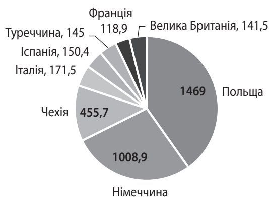
Рис. 4. Кількість українських громадян, які виїхали з України протягом 2022 р. у країни Європи, тис. осіб