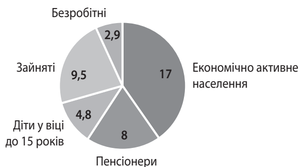
Рис. 3. Кількість і вид населення України станом на травень 2023 р., млн осіб

Джерело: складено авторами за даними [5].