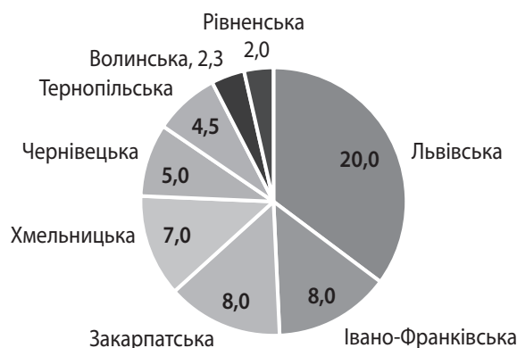
Рис. 5. Внутрішня міграція за кількістю громадян в областях України протягом 2022 р., тис. осіб

Зокрема, станом на березень 2022 р. обласні адміністрації повідомляли про таку кількість внутрішньо переміщених осіб (ВПО) (рис. 5).