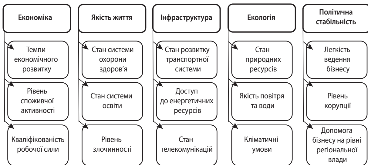
Рис. 2. Ключові зони екзогенного та ендогенного впливу на рівень інвестиційної привабливості регіону