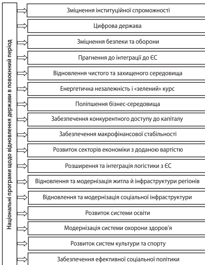
Рис. 2. Основні пріоритетні напрями відбудови України в повоєнний період