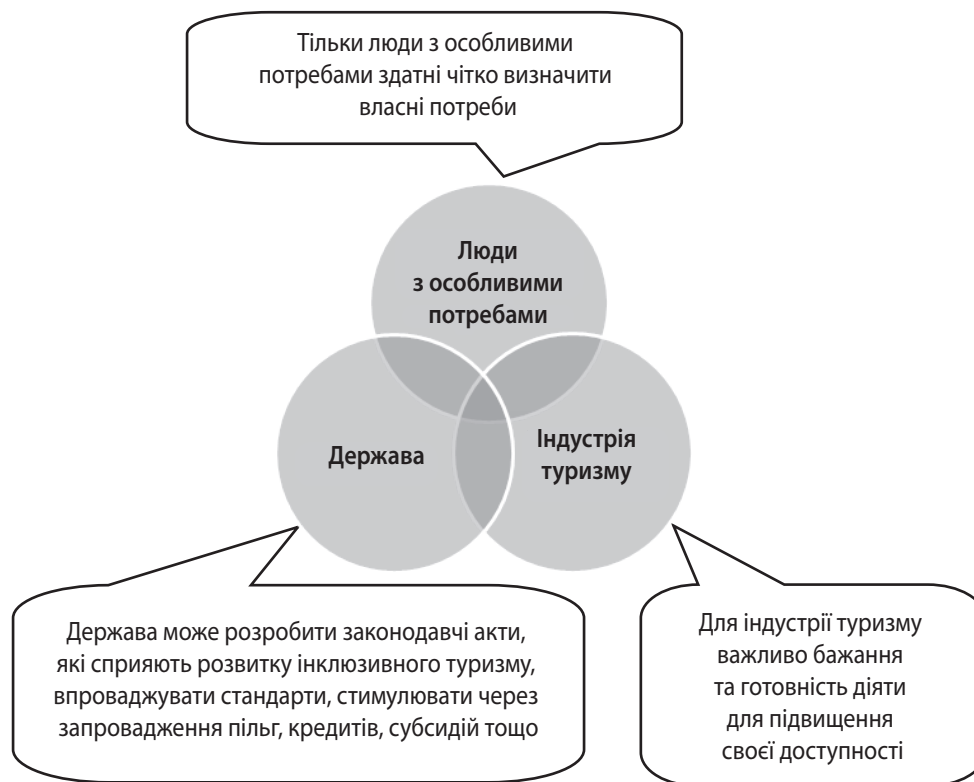
Рис. 2. Концептуальна основа розвитку інклюзивного туризму