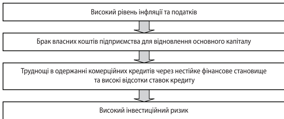
Рис. 2. Фактори впливу на рівень розвитку інвестиційної політики підприємства