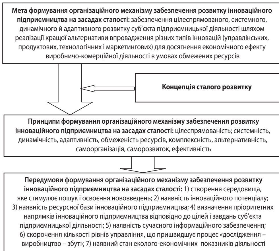
Рис. 1. Базові положення та передумови формування організаційного механізму забезпечення розвитку інноваційного підприємництва на засадах сталості