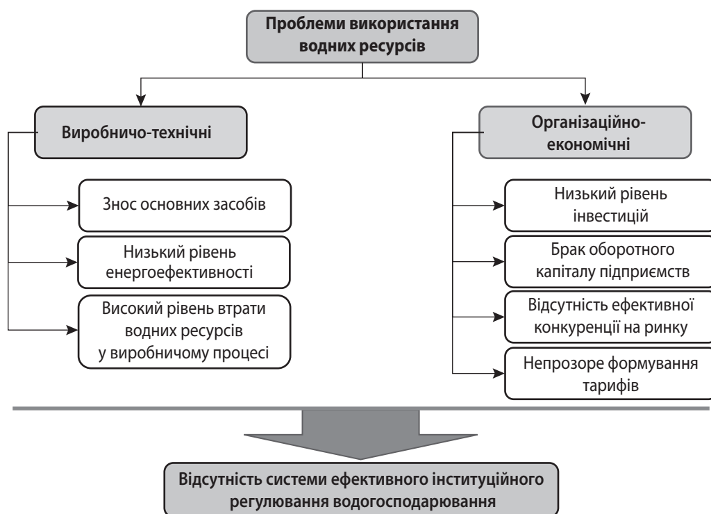
Рис. 1. Причини низької ефективності водогосподарської сфери в Україні

З іншого боку, важливо на національному рівні реалізувати розвиток механізмів громадського консультування, публічного обговорення та участі у прийнятті рішень, що дозволяє забезпечити більшу легітимність і підтримку у сфері управління водними ресурсами. Такий механізм також дозволить залучити публічні фінанси в оновлення інфраструктури водного господарства країни та відбудову тих її елементів, що були зруйновані внаслідок війни. Варто зазначити, що в контексті