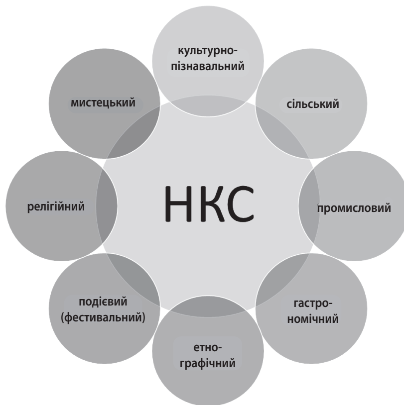
Рис. 3. Види туризму які можна розвивати на основі використання об'єктів нематеріальної культурної спадщини

кож не претендує на виключну повноту та може бути розширений і доповнений, що відкриває перспективи для подальших розвідок у цьому напрямі.