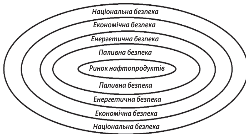
Рис. 1. Модель відносин ринку нафтопродуктів та національної безпеки