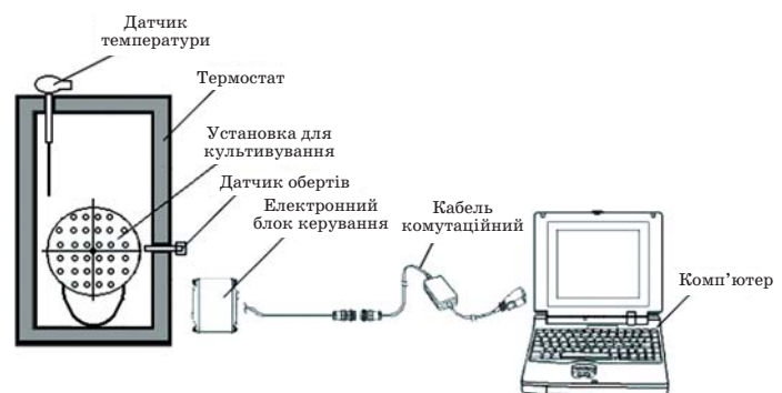
Рис. 1. Схема дослідної ролерної установки для культивування клітин та біосинтезу ІФН

Контроль за технологічним процесом та введення згаданих параметрів культивування здійснювалось комп'ютером за допомогою програми BioTech v.1, розробленої спеціально для виконання цієї роботи.