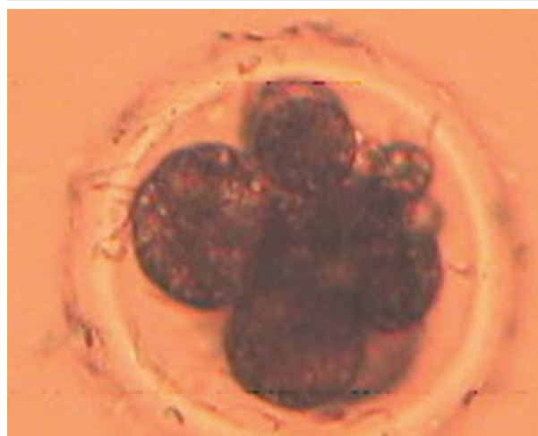
Рис. 2. 6–10-клітинний зародок свиней, одержаний in vitro . \times 100

У досліджах із запліднення ооцитів ссавців в умовах in vitro слід виконувати контроль за партеногенетичним розвитком ооцитів, який здійснюється під впливом факторів маніпуляцій із ооцитами або факторів середовища. Частота впливу різних хімічних та фізичних чинників в умовах in vitro вища, ніж у природних умовах, що спричинює дестабілізацію мейотичного блоку ооцитів. Унаслідок такого активування ооцитів утворюються зиготи з одним пронуклеусом і розвиваються гаплоїдні ембріони. Під час здійснення нами зазначеного контролю яйцеклітини, що дозріли поза організмом, культивували у середовищі запліднення без сперматозоїдів упродовж 18 год. Потім яйцеклітини переносили у середовище культивування ембріонів та оцінювали на предмет наявності ембріонів або пронуклеусів на основі цитогенетичного аналізу.