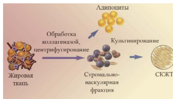
Рис. 1. Схема выделения стромальных клеток из жировой ткани

(СК), причем источником достаточно богатым — из 300 мл жира авторы получали от 10 до 20 \cdot 10^6 клеток, названных ими «СК обработанного липоаспирата» (processed lipospirite, PLA). Метод этих авторов, схематически приведенный на рис. 1, заключался в обработке липоаспирата коллагеназой (фрагменты жировой ткани инкубировали при 37 °С в 0,075% -м растворе коллагеназы типа I в течение 30 мин). Центрифугирование первичной суспензии приводило к ее разделению на две фракции. В верхнем светлом слое располагались адипоциты, а в осадке — клетки СВФ с примесью гемопоэтических клеток. Эритроциты удаляли с помощью инкубации в лизирующем растворе хлорида аммония, а другие гемопоэтические клетки, обладающие слабой адгезивной способностью, элиминировались при пассировании.