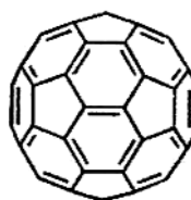
Рис. 1. Структура молекули C_{60}

Особливе місце серед фулеренів посідає молекула C_{60} , що має найвищий ступінь симетрії і є найбільш стабільною. Сферична поверхня C_{60} містить 20 правильних гексагональних і 12 пентагональних структур, чим нагадує поверхню футбольного м'яча (рис. 1). Зв'язки між сусідніми гексагонами (завдовжки 1,35 Å) є подвійними, а зв'язки між гексагонами та пентагонами (завдовжки 1,47 Å) — одинарними. Таким чином, гекса- та пентагональні одиниці поєднані кон'югованою \pi -електронною системою, чим і пояснюється компактне укладання атомів вуглецю, малі розміри молекули та її властивості [2, 3]. Так, площа поверхні молекули C_{60} утричі менша, ніж очікувана для біологічної молекули такої самої молекулярної маси (720 Да), а її діаметр становить лише 0,714 нм, тобто за величиною є близьким до діаметра \alpha -спіралі поліпептидів або молекули стероїдів. Це дає підстави припустити, що стерично молекула C_{60} є цілком сумісною з біологічними структурами, наприклад упізнавальними сайтами рецепторів або активними центрами ензимів.