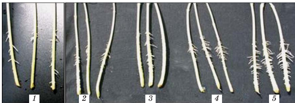
Рис. 1. Ризогенез живців квасолі після оброблення розчинами ІОК (25 мг/л) та БК: 1 — контроль (вода); 2 — ІОК; 3 — ІОК + БК (0,05 г/л); 4 — ІОК + БК (0,01 г/л); 5 — ІОК + БК (0,001 г/л)