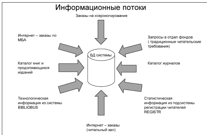
Рис. 1 Информационные потоки.