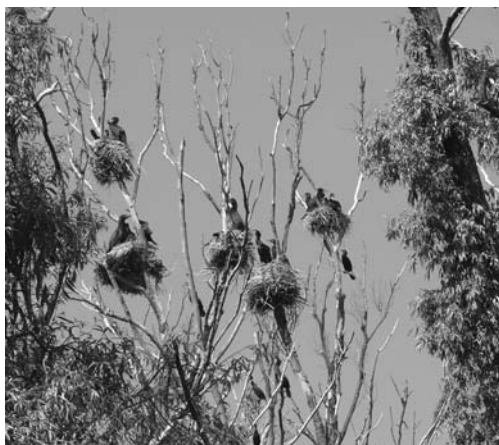
Рис. 2. Колония бакланов на о. Круглик Каневского заповедника. 30.05.2007 г.

Бакланы гнездятся на вербах ( Salix alba ), как на живых, так и на мертвых деревьях (рис. 2). Причем их гнездование ведет к усыханию деревьев из-за более едкого, чем у цапель, помета. К тому же бакланы при постройке гнезд обрывают зеленые веточки, кроны деревьев сильно разреживаются (рис. 3). Сейчас колония на Круглике хорошо заметна издали благодаря образовавшейся "пропелешине". Гнезда бакланы располагают в разнообразных местах - в развилках ветвей у основного ствола, на боковых ветках, на вершинах деревьев.