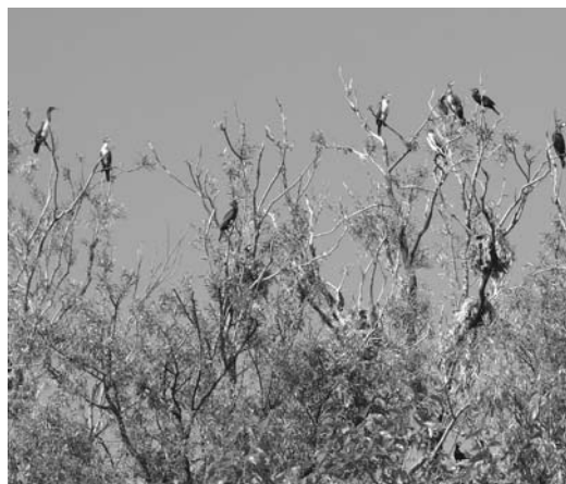
Рис. 3. Бакланы при постройке гнезд обрывают зеленые веточки, разрежая кроны деревьев. 6.06.2007 г.