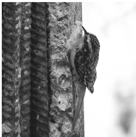
Рис. 2. Гнездование пищухи в опоре ЛЭП. Fig. 2. The nest of Tree Creeper in the electricity pylon.

В целом, можно констатировать положительное значение воздушных электролиний для многих редких видов, прежде всего хищных птиц, особенно, как искусственных аналогов древесной растительности на открытых ландшафтах, доминирующих в Степном Крыму. Чаще всего, а порой и массово, ЛЭП используют врановые, прежде всего галка: провода – как присаду, а полые опоры – еще и как место гнездования. Для этого вида, как и для ворона ( Corvus corax ), опоры ЛЭП в Степном Крыму являются основным местом гнездования. Также довольно часто линии электропередачи исполь-