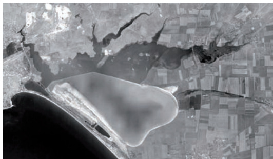
Рис. 2. Озеро Сасык-Сиваш.