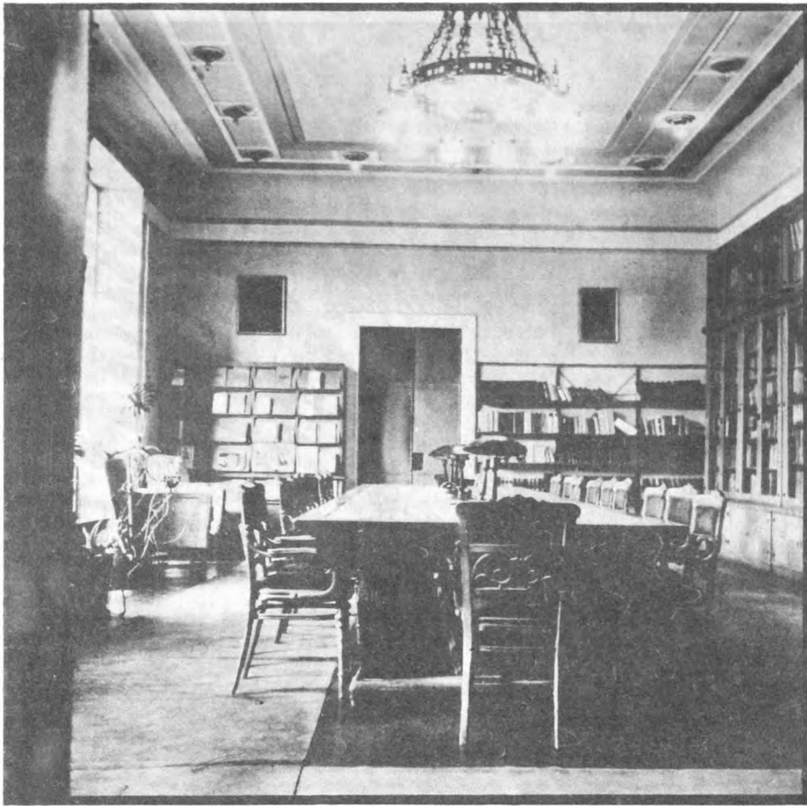
● La bibliotheque centrale universitaire Lucian Blaga Cluj, Roumanie