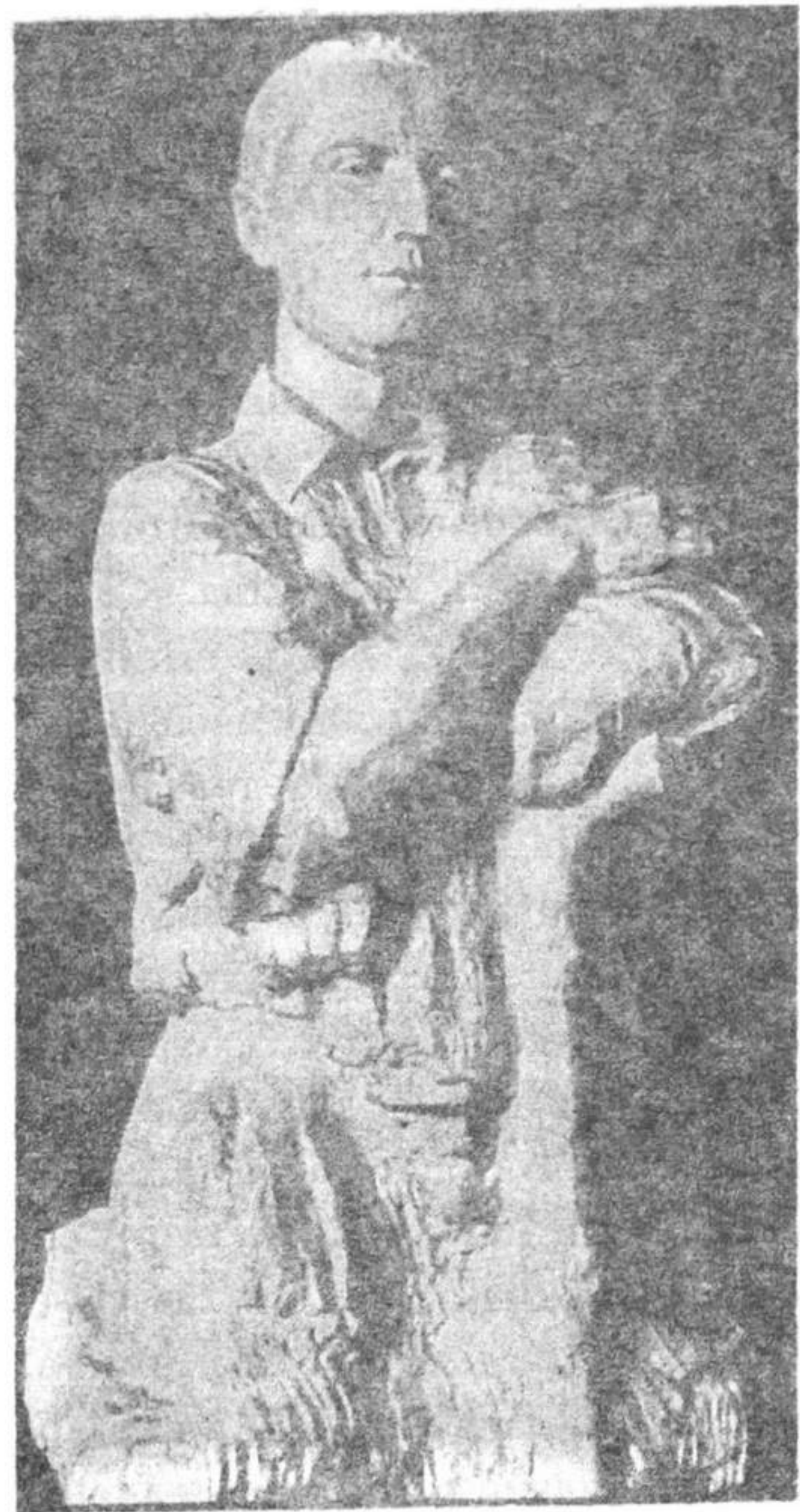
● Л.М.Толстой. 1956. Скульптор І.Кавалерідзе.