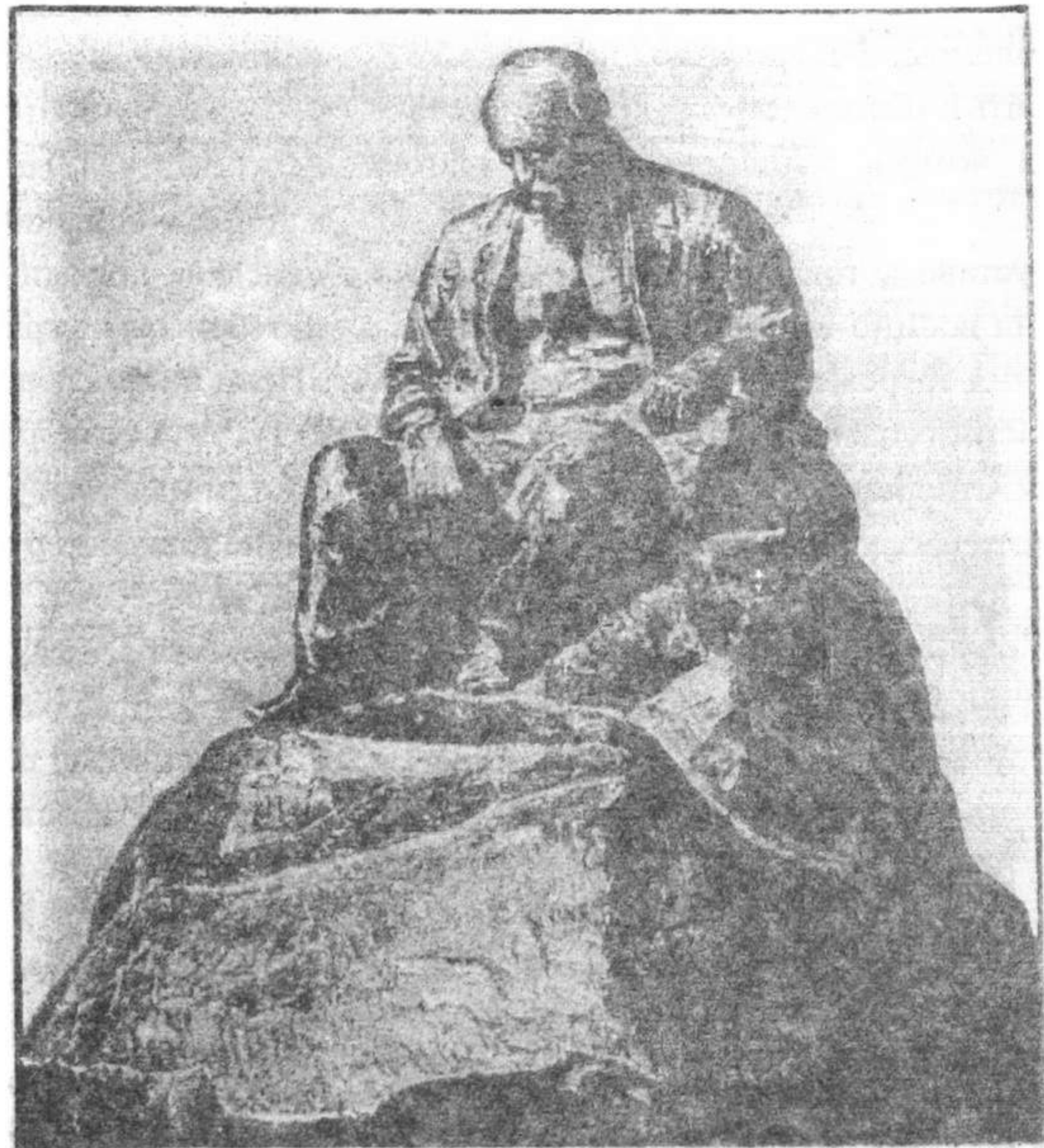
● Проект пам'ятника Т.Г.Шевченку в Ромнах. 1918. Скульптор І.Кавалерідзе.