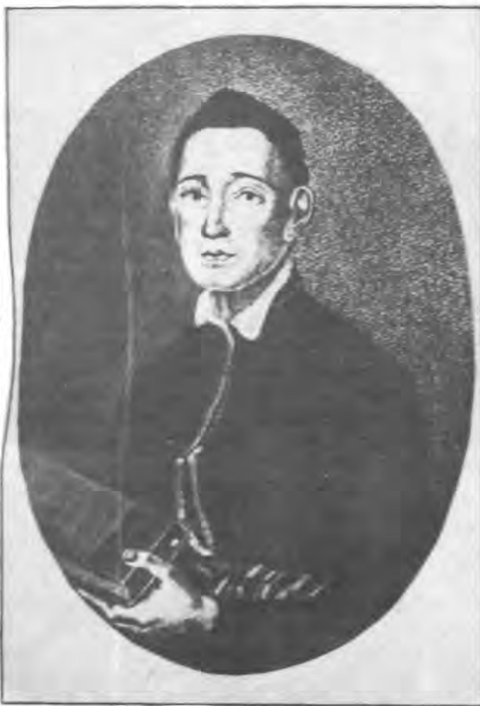
Г.Сковорода. З картини невідомого художника

Зміцнювалися пута кріпацтва. Зростала розкіш козацької знаті. А родина Сковорода на цьому тлі виглядала зовсім бідно. Зрозуміло, що малий Григорій не міг не відчувати тої явної відмінності.