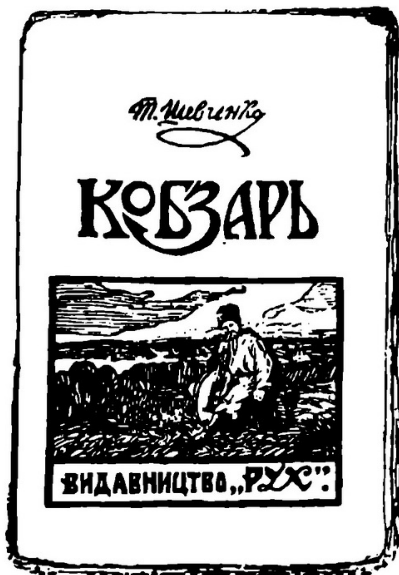
Т.Г.Шевченко. «Кобзар», вид-во «Рух», 1918.