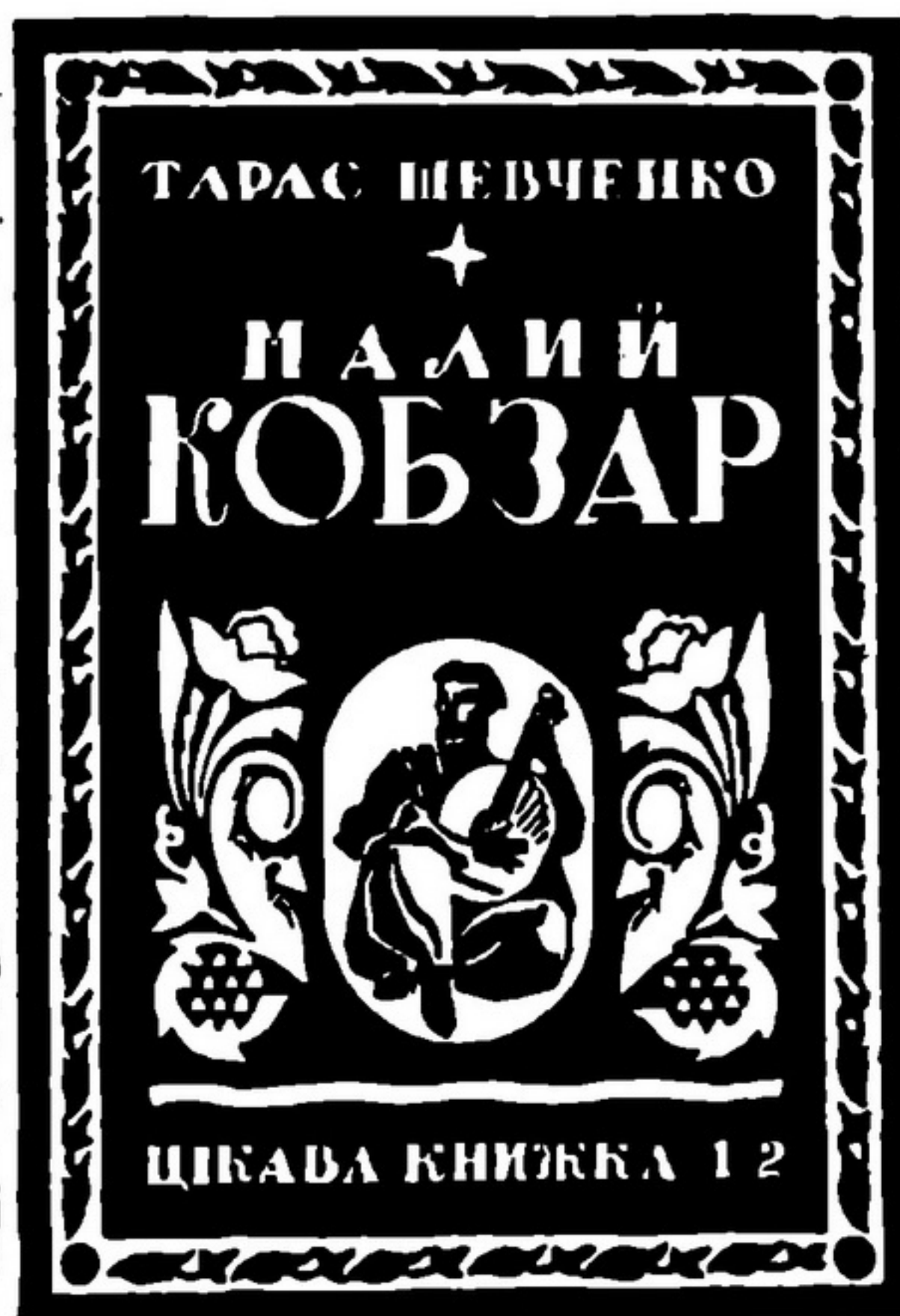
Т.Г.Шевченко. «Малий кобзар», 1937.