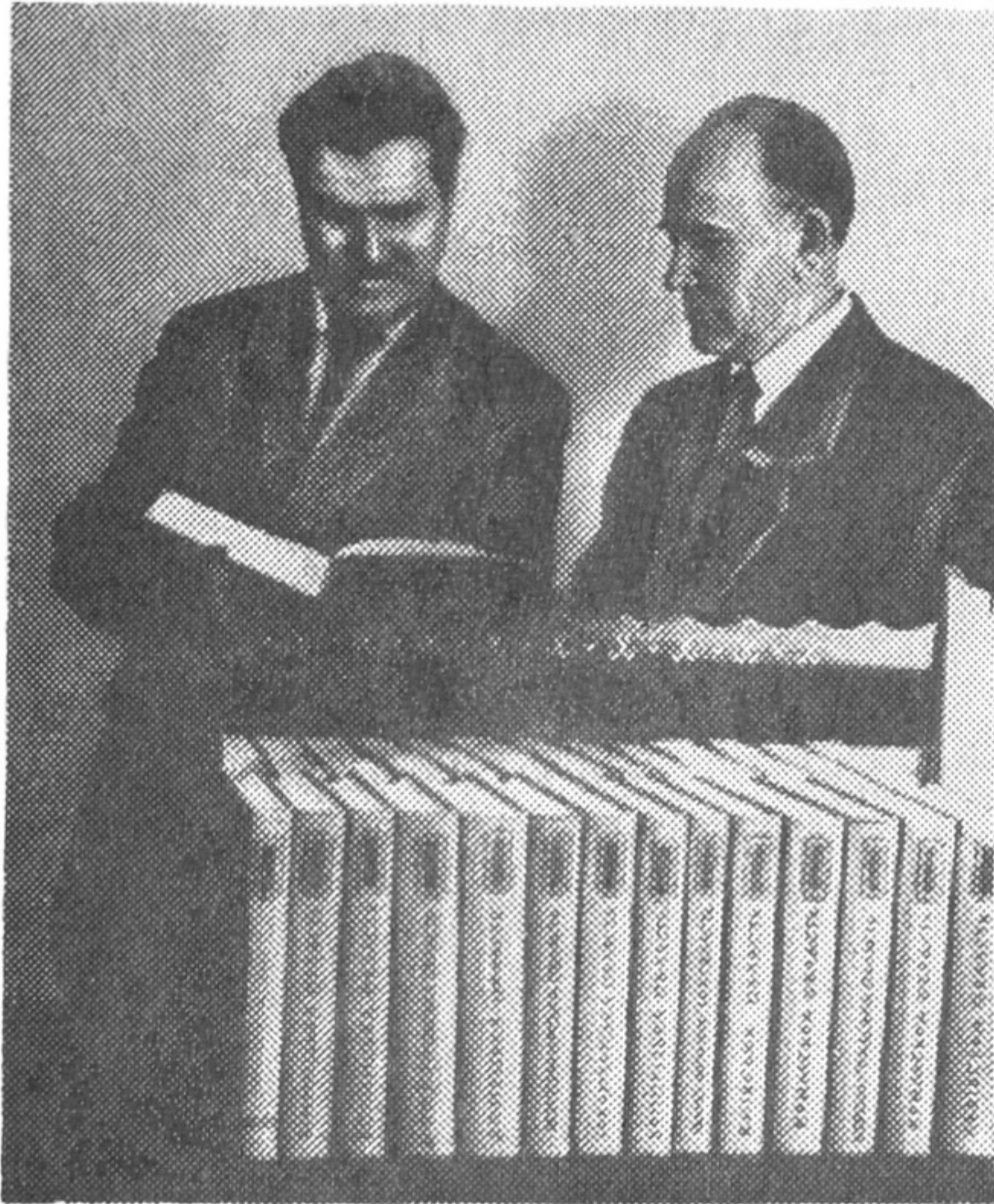
Завершено велику роботу.

Залюбки ходив до школи, що носила в ті часи ім'я Бориса Грінченка (потім це ім'я зняли). У класі висів портрет Шевченка. Заняття велися українською мовою і закінчувалися співом «Заповіту».