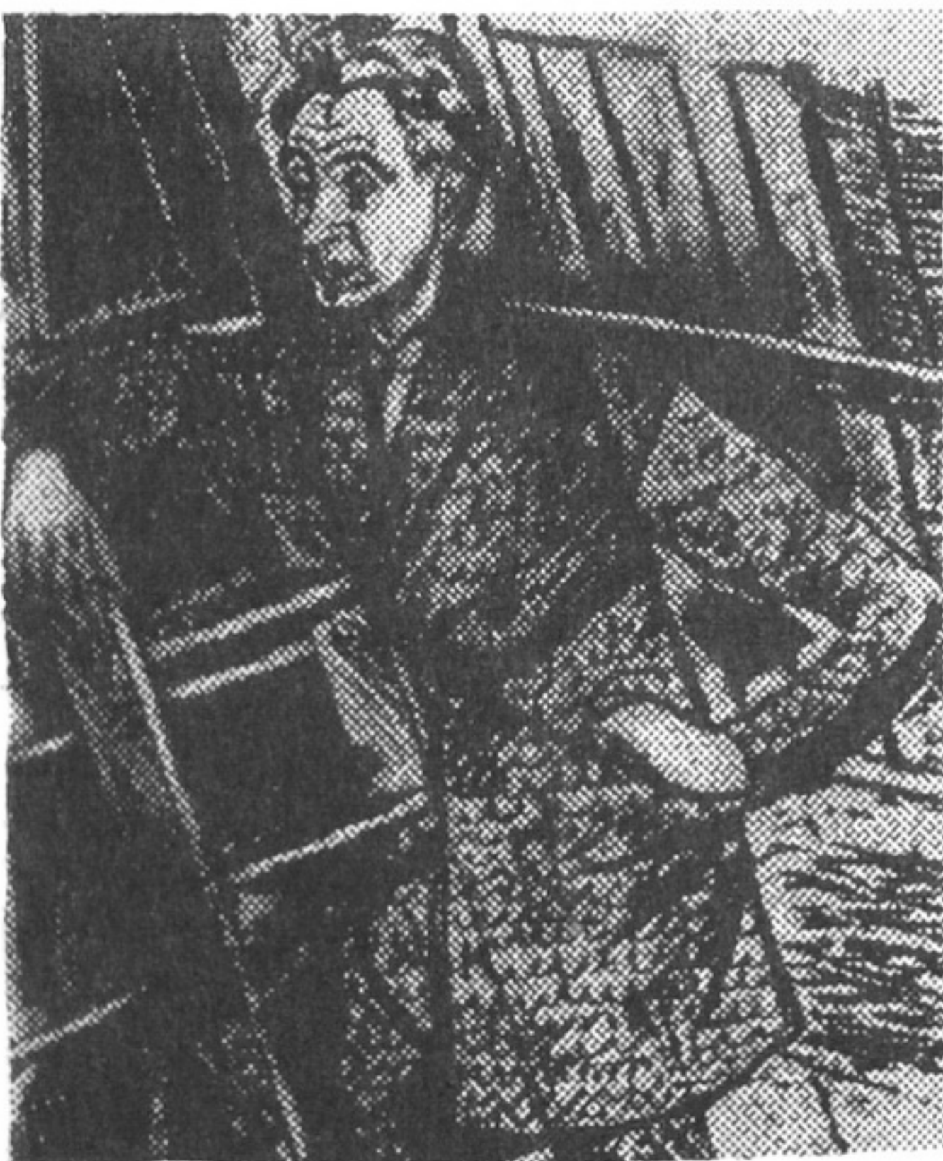
Портрет Л.Курбаса. 1929. Папір, акварель

Відзначено столітній ювілей видатного українського художника Анатолія Петрицького, репродукції творів якого зберігаються в багатьох бібліотеках, зокрема в секторі естампів та репродукцій ЦНБ ім. В.І.Вернадського. Петрицький - живописець, сценограф, книжковий графік - усюди він був блискучим митцем. Чимало його шедеврів зажили європейської слави. В 1947 р. офіційно було заборонено імпресіонізм. Писати у стилі соцреалізму Петрицькому не дозволяла його висока шляхетна культура митця і людини. Спалах творчості, розкнутості майстра, хоч як це дивно, припадає на воєнне лихоліття. Це - динаміка, емоції, крик серця і душі, що картається від нестерпного болю, виплеснутого на полотні. З тим болем жив, з тим болем помер - лише в роботах своїх залишивши нам свою потаємну надію на свободу художника, на вільне мистецтво.