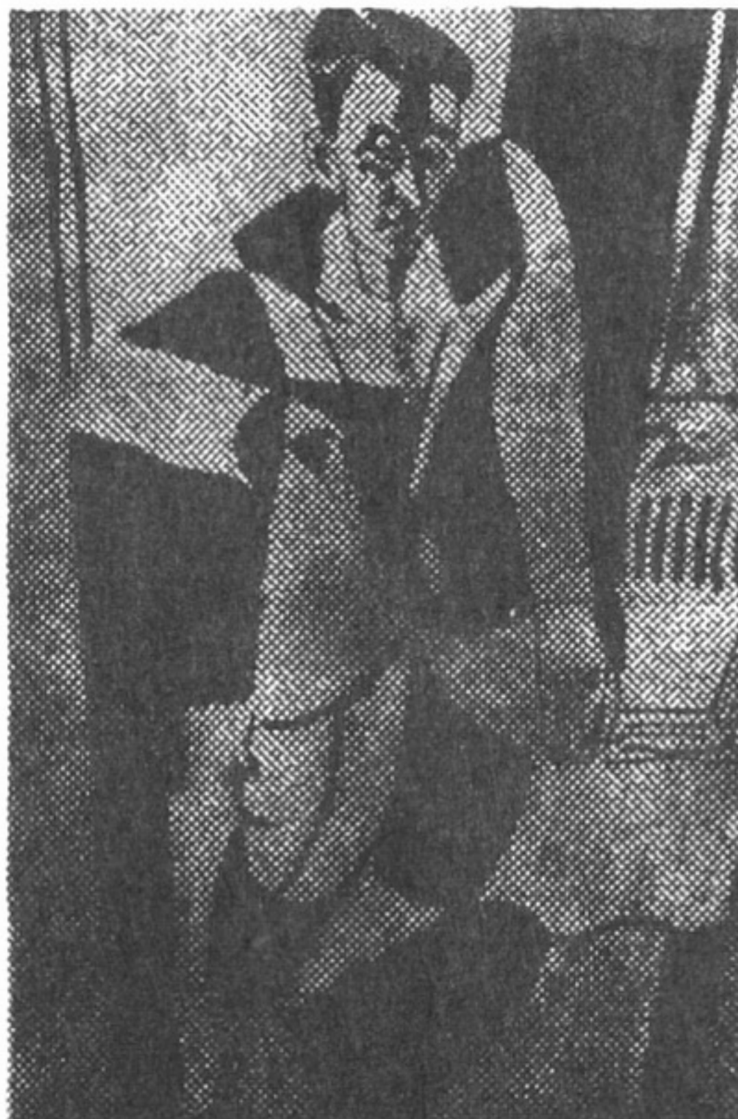
Портрет Ю.Яновського. 1929. Папір, акварель