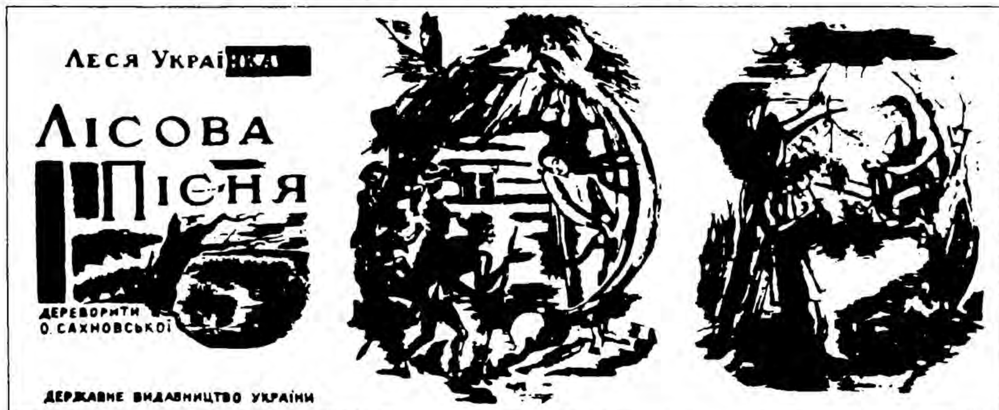
Обкладинка та ілюстрації до драми-феєрії Лесі Українки «Лісова пісня». 1929 р.