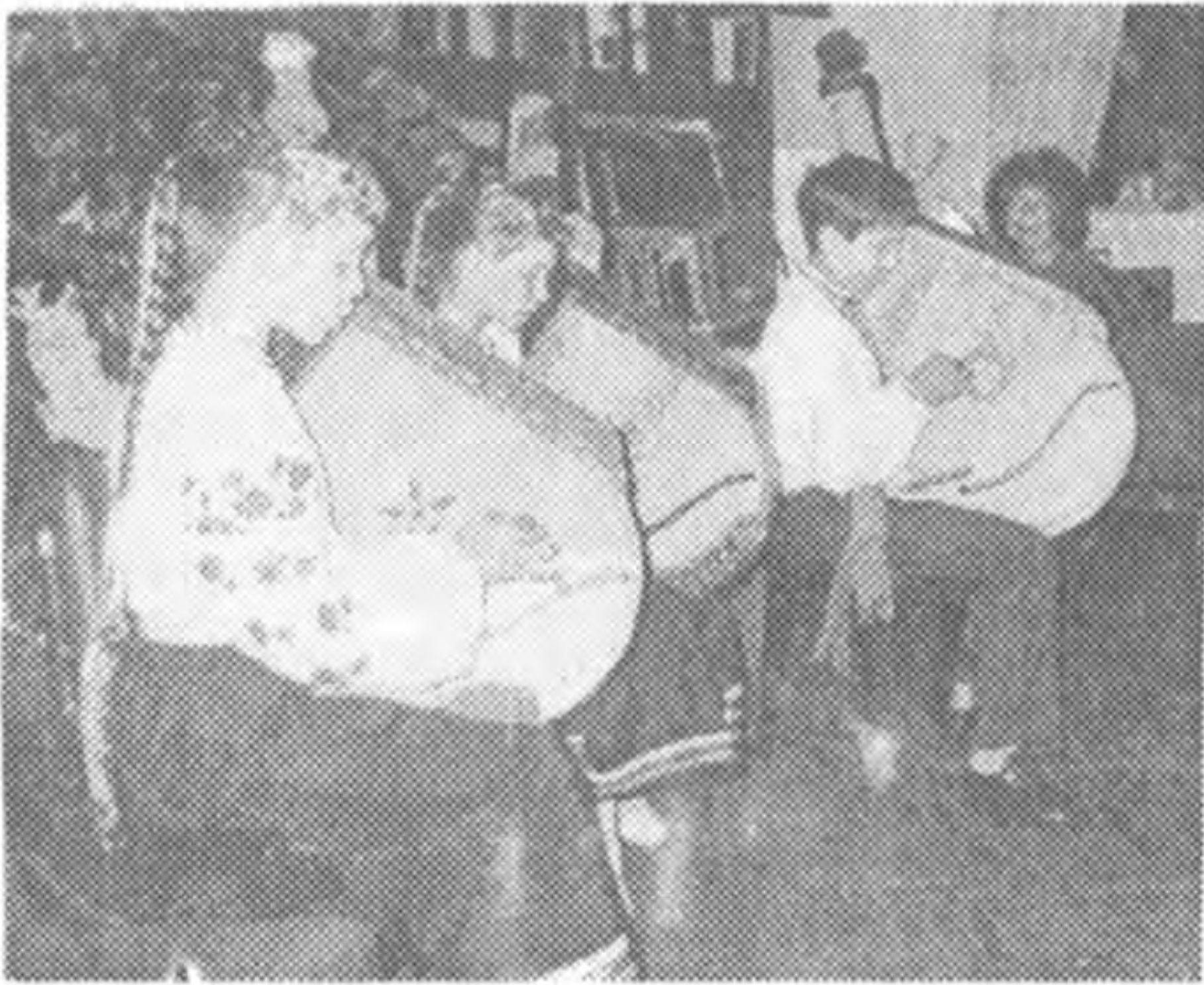
Тріо бандуристів музичної школи №32