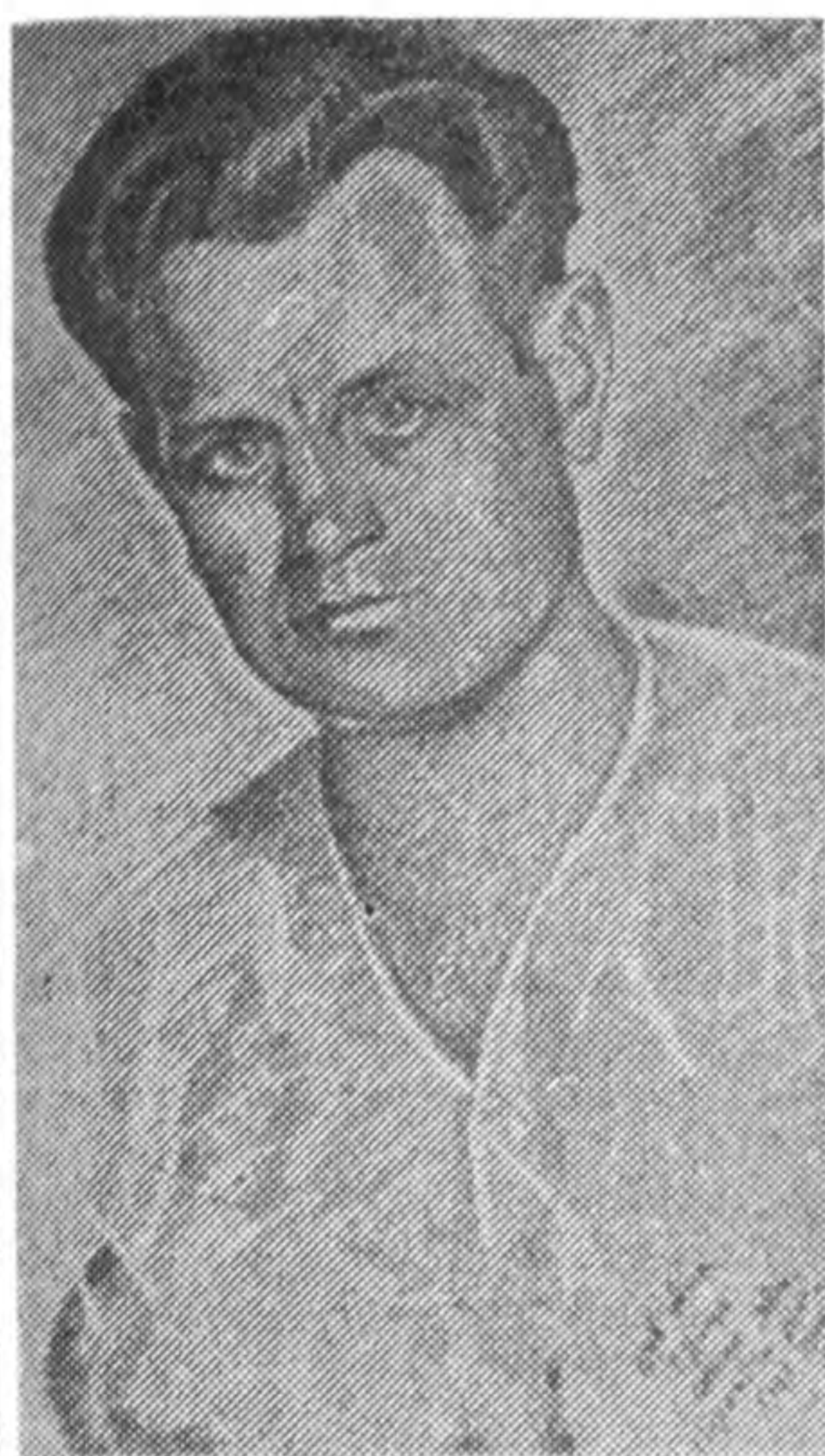
Портрет Г.Китастого у виконанні І.Багрянного. Олівець. Турка. 1 травня 1944 р.