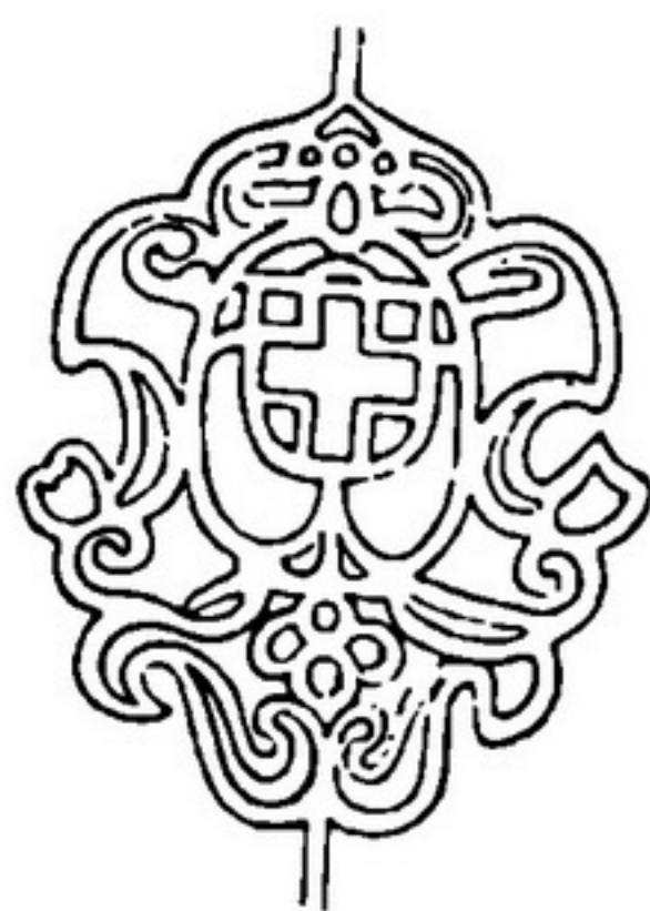
Водяний знак із «Беседи св. Іоанна Златоуста на 14 посланій». 1623.