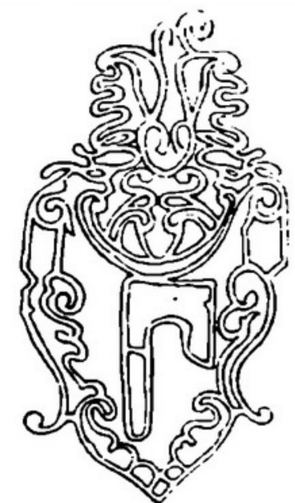
Водяний знак із Анеологіона. 1619.