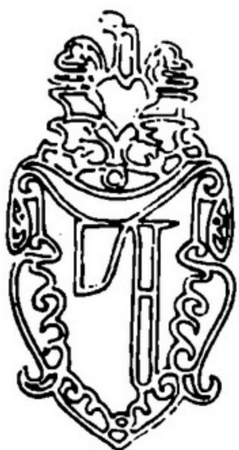
Водяний знак із Анеологіона. 1619.

Особливе місце серед загально методологічних статей розділу «Методологія і соціологія права» займає нарис «Держава і особистість». У ньому Кістяківський виклав соціально-політичні висновки з філософських та правознавчих поглядів. Він відкинув проголошувану багатьма його колишніми однодумцями (зокрема такими видатними філософами, як Бердяєв, Булгаков, Струве) на початку ХХ ст. необхідність творення ідеології чи нової релігії як сутнісної умови існування людської духовності, способу віддзеркалення у ній таких суспільних феноменів, як держава та нація. Слід зазначити, що цей мотив виникає і нині, таку ж мету як засіб подолання ідейної кривизни суспільства висувують і деякі сучасники. Залишаючись «науковим ідеалістом», філософ відшукав та обґрунтував перспективу побудови і демократичного правового й соціального суспільства та відповідне до неї завдання розвитку суспільної правосвідомості і встановлення норм права і правових інституцій як реалістичну програму дій інтелігенції. За складних обставин життя передреволюційної Росії, на роздоріжжі між імперським консерватизмом і більшовицьким радикалізмом, він визначив шлях, що на нього ми намагаємося повернутись нині, щоб ввійти до світової спільноти. Слід ясно бачити, що саме необхідно зробити для цього та чого нам бракує - і в науковому, і в практичному напрямках, слід визначити, чому свого часу суспільство не пішло цим шляхом і чи не станеться так, що воно омине його в майбутньому.