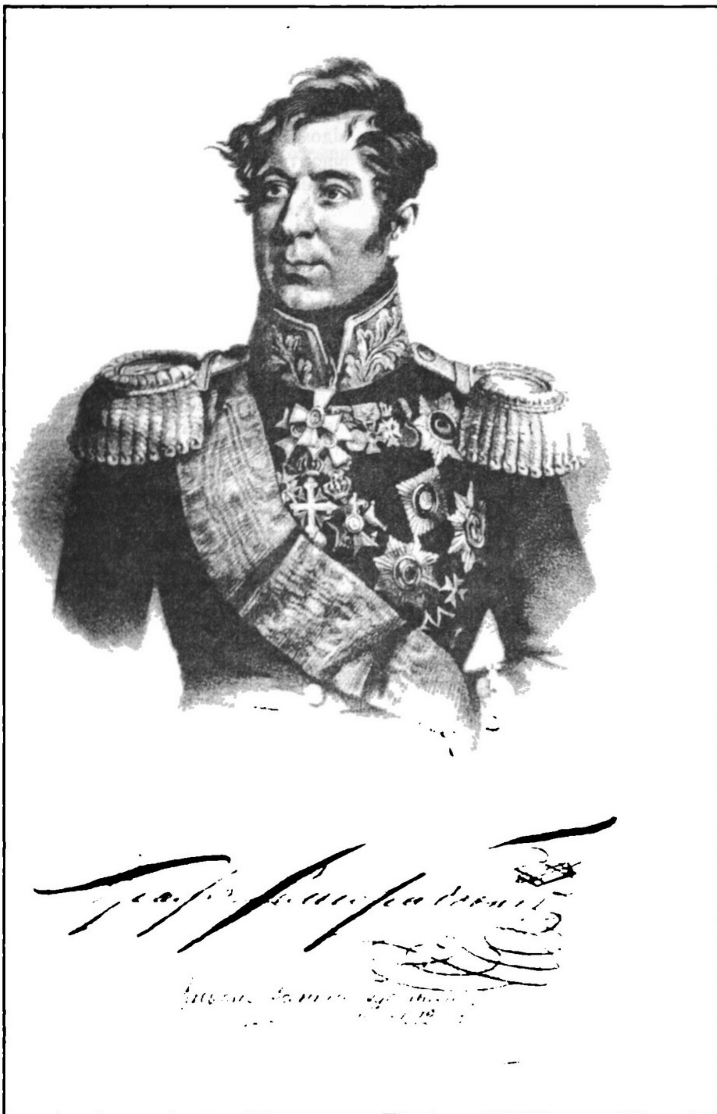
Портрет київського військового губернатора графа Михайла Андрійовича Милорадовича. Не пізніше 1882 р. Літографія П.Ф.Бореля. Дарунок графа Г.О.Милорадовича.

виразності. Митець зобразив представників аристократії - князя Клеменса Меттерніха та графа Йозефа Естергазі, мистецьких кіл - композитора Йоганна Штрауса (батька)