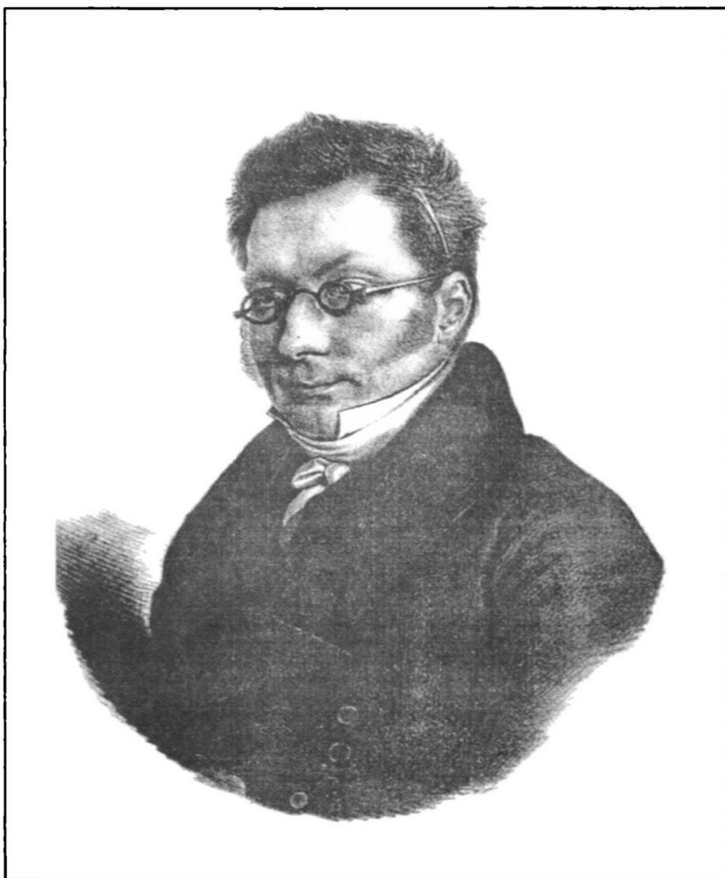
Прююпттевий портрет декабриста барона Володимира Івановича Штейнгеля. 1823. Автолитографія О.Г.Естеррейха.

У статті розповідається про підбірку графічних портретів з колекції сектора естампів та репродукцій Національної бібліотеки України імені В.І.Вернадського, характеризується творчість у жанрі портретної графіки таких митців різних національностей, як Й.Кригубер, О.Естеррейх, П.Ф.Борель, А.Муільрон, Ф.Красицький.