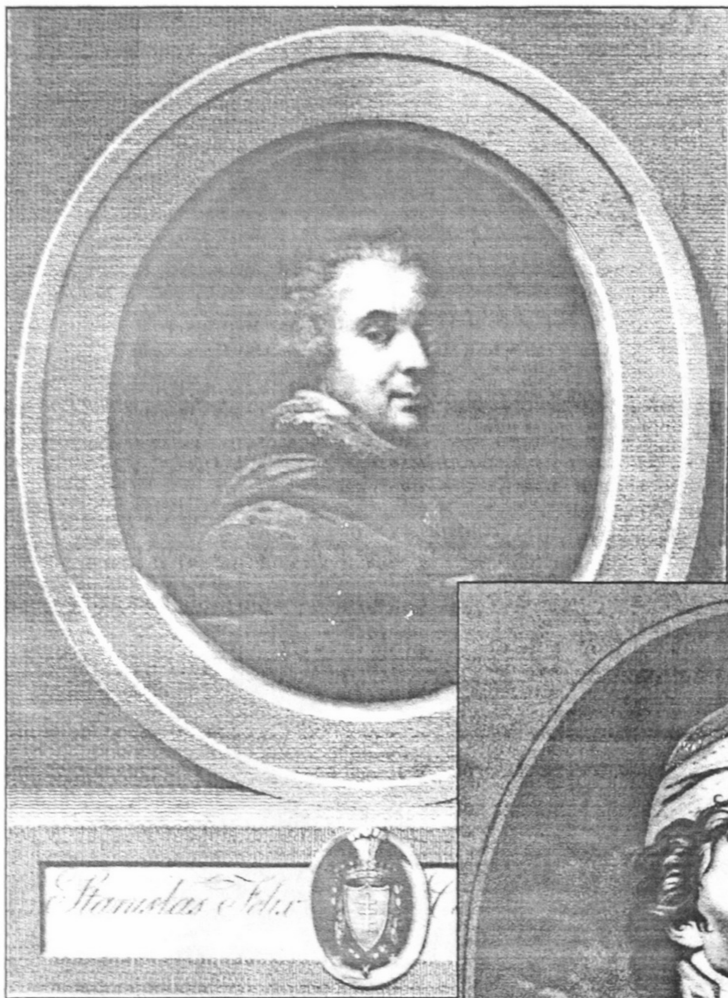
Портрет польського графа Станіслава Фелікса Потоцького. 1807 р. Різдева гравюра Ігнатія Себастьяна Клаубера за оригіналом Йоганна Баптиста Лампі старшого (1788) (Klauber Ignace Sebastian, Lampi Johann Baptist).

чуємо появою таких високопрофесійних і талановитих майстрів, як М.І.Уткін, С.Ф.Галактіонов, А.Г.Ухтомський. На виставці в НБУВ представлялися роботи Клаубера 1802 і 1807 років: портрети президента Академії мистецтв і власника відомої свого часу колекції живопису, графіки й нумізматики графа О.С.Строганова та польського графа С.Потоцького, колишнього володаря парку