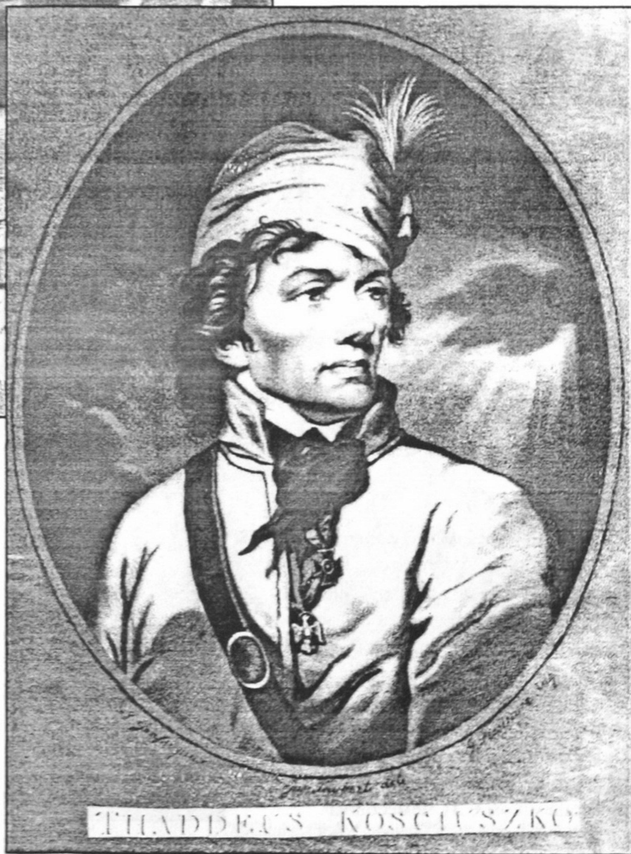
Портрет польського військового діяча Тадеуша Костюшка. 1795 р. Гравюра на міді Франца Габріеля Фісінгера за оригіналом Йозефа Грассі (Fiesinger Franz Gabriel, Joseph Grassi).