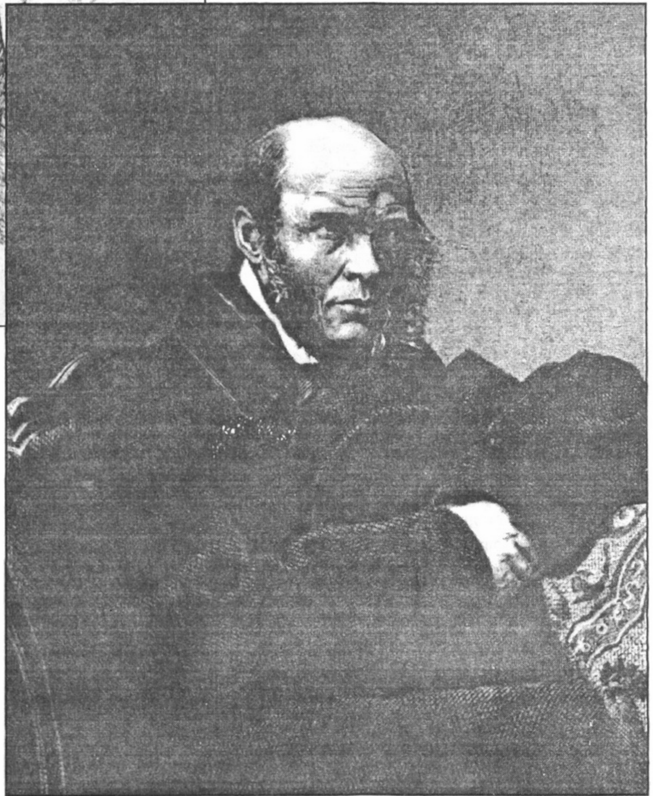
Портрет видатного російського хірурга, попечителя Київського та Одеського навчальних округів М.І. Пирогова. Не пізніше 1861 р. Гравюра на сталі Альберта Генрі Пейна (Albert Henry Payne).

З кінця XVIII ст. понад 20 років посаду керівника гравюрного класу єдиної в Росії Академії мистецтв у Петербурзі посідав видатний німецький гравер на міді Ігнатій Себастьян Клаубер 5 , який, крім таланту художника, мав неабиякий хист викладача. Він підніс гравюрну справу на небувалу висоту. Це йому завдя-