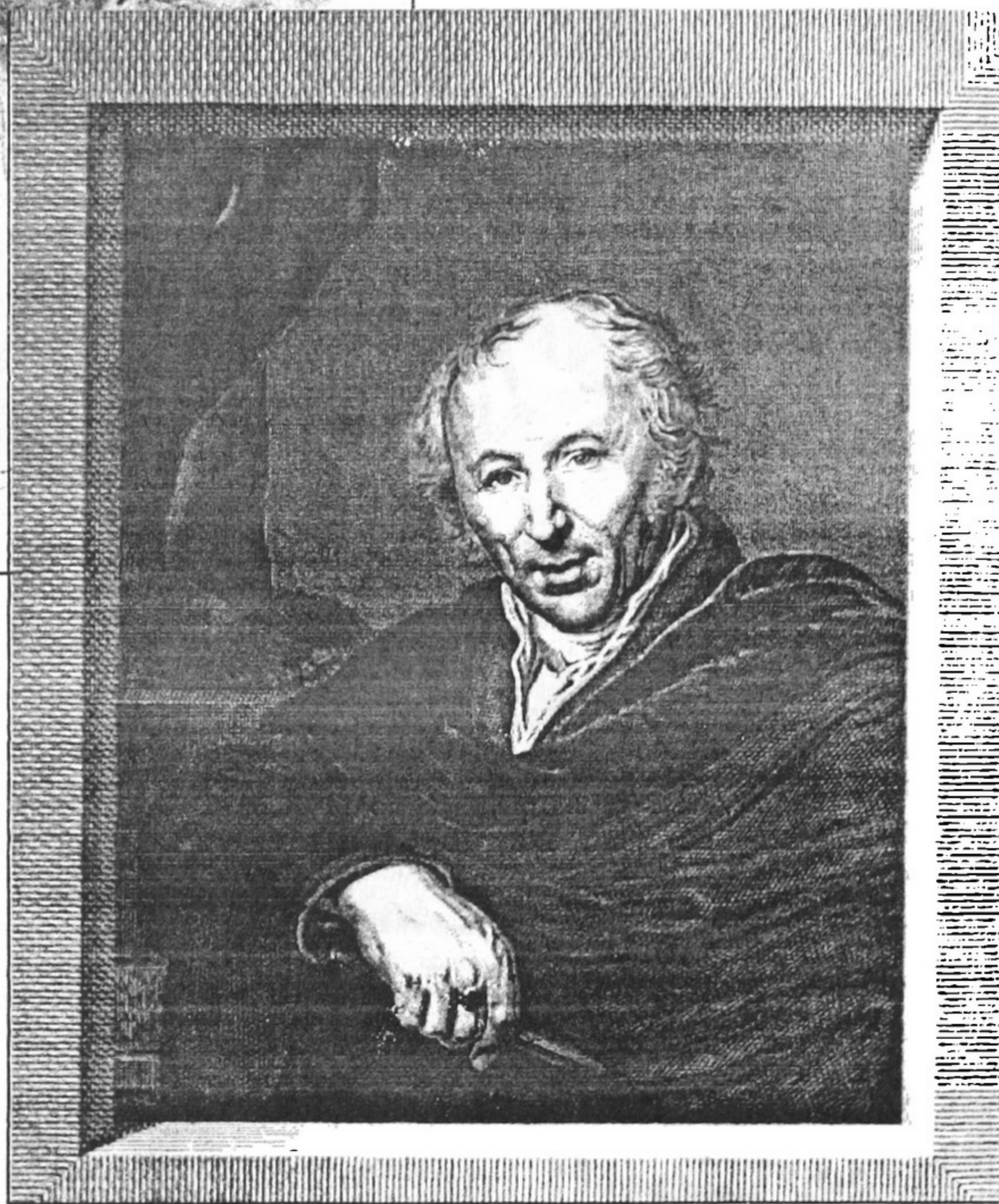
Портрет видатного скульптора, ректора Академії мистецтв у Петербурзі, уродженця Чернігівщини І.П.Мартоса. 1821 р. Ріцева гравюра С.Владимирова за оригіналом О.Г.Варнека.

У другій половині цього століття дереворит витісняється мідьоритом навіть у церковних виданнях. Підтвердженням тому є кілька десятків мідних гравірувальних дощок з колекції сектора естампів та репродукції НБУВ. Вони виконані штихелем українських граверів Івана Стрельбицького, Олександра тарасевича (Тарасевича, в чернецтві - Антоній, бл. 1640-1727) й Леонтія Тарасевича (бл. 1650-1710), Івана Мигури, братів Йосипа й Адама Гогемських, Івана Щирського, Григорія Левицького та ін. Є серед цих дощок і портретні. І.Мигура 1706 р. вигравірував портрет Івана Мазепи в латах, а Г.Левицький 1739 р. - порт-