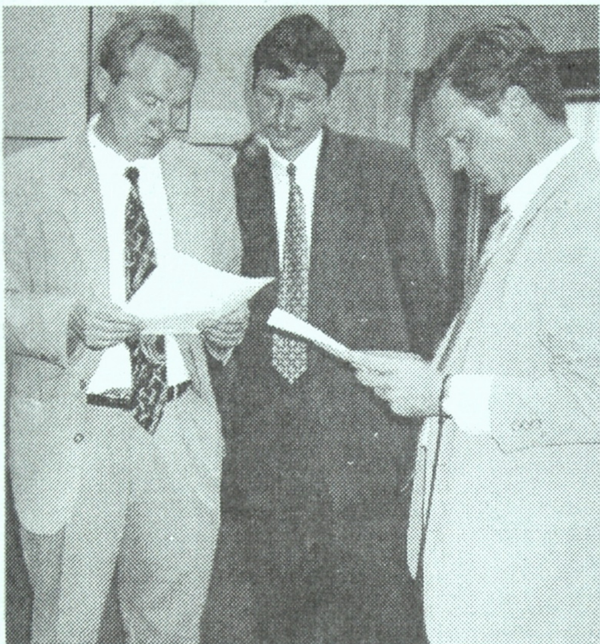
Надзвичайний і Повноважний Посол Литовської Республіки в Україні Вітаутас Плечкайтіс, перший секретар Посольства Регімантас Яблонкас, перший секретар Посольства Полінаріс Чіжаускас перед відкриттям виставки.

У Національній бібліотеці України імені В.І.Вернадського пройшли цікаві виставки: книг і документів «Литва - Батьківщина наша. 1918-1998 рр.», фотоматеріалів «Відродження Литви. 1988-1998 рр.». Ця подія віддзеркалює розвиток і подальше зміцнення культурних зв'язків між національними бібліотеками України й Литви і приурочена до 80-ліття проголошення та 10-ї річниці відновлення незалежності Литовської держави. Матеріали для експозиції було надано Національною бібліотекою Литви імені М.Мажвідаса. Ювілейна акція відбувалася за сприяння Посольства Литовської Республіки в Україні.