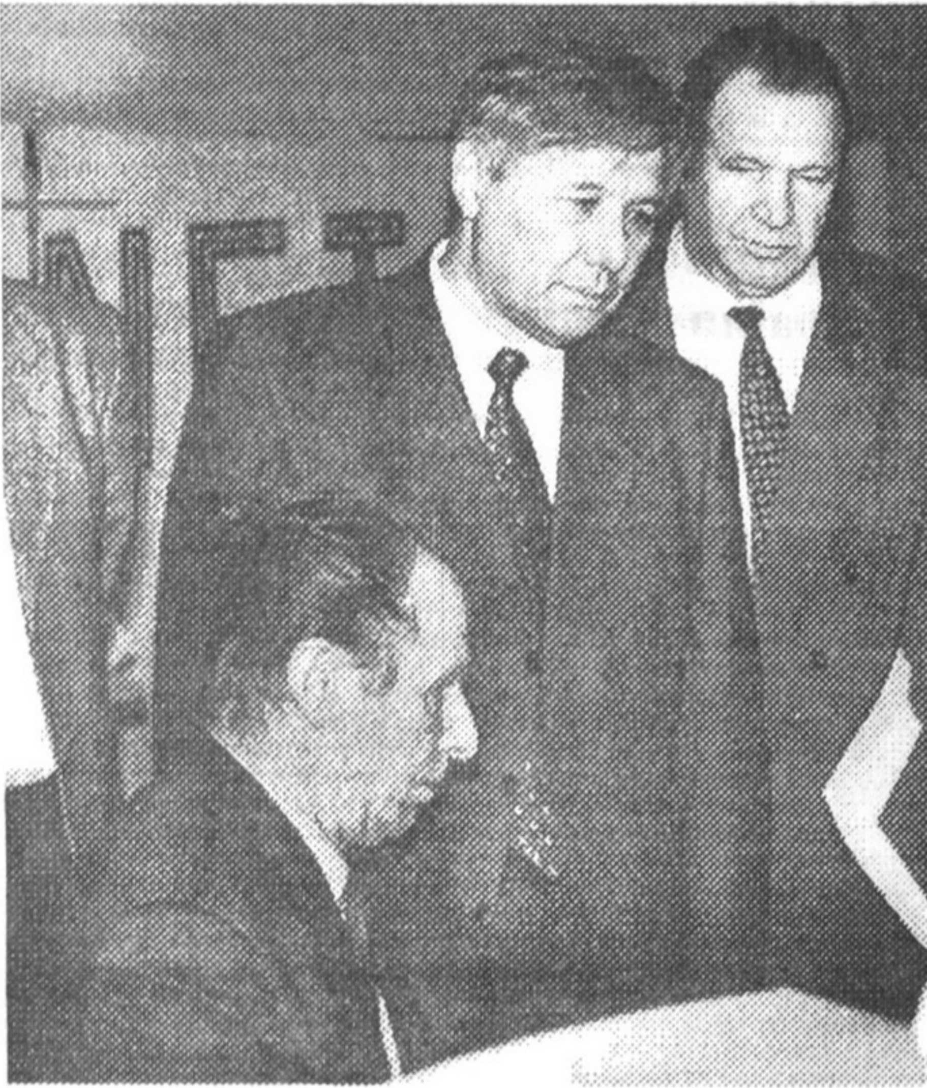
На знімку зліва направо: керівник Центру бібліотечно-інформаційних технологій Л. Й. Костенко, перший віцепрем'єр-міністр України Ю. І. Єхануров, генеральний директор НБУВ О. С. Онищенко.

фінансових процесів, фінансових потоків — найважливіший підсумок 2000 р. Позитивно для держави те, що стабілізувалася гривня.