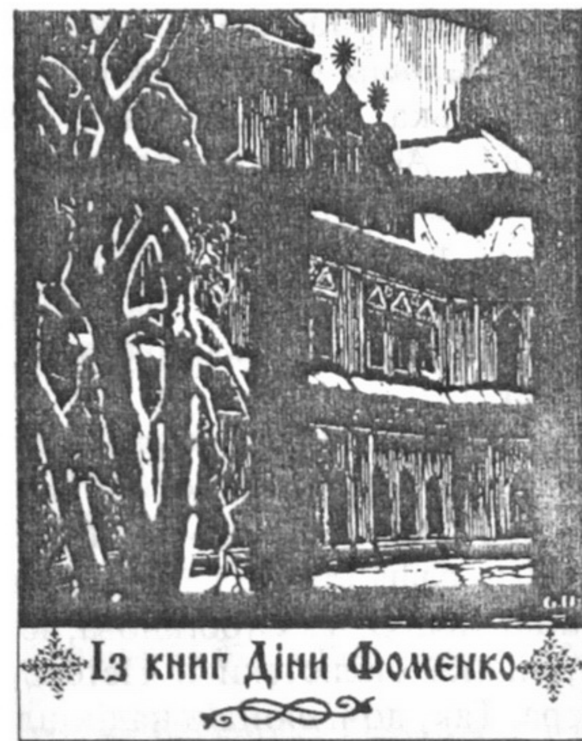
Автор екслібрисів Г. Юхимець