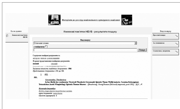
Рис. 2. База даних «Книжкові пам'ятки НБУВ»

ментів, перегляд інформації про колекції та місця зберігання документів. А з розвитком пошуково-го інструментарію буде реалізовано також навігацію за списком назв та типом книжкових колекцій НБУВ.