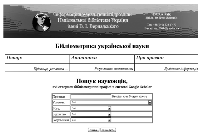
Рис. 3. Головна веб-сторінка проекту «Бібліометрика української науки»

вання своїх робіт. Вони можуть отримати список публікацій, упорядкований за кількістю цитувань, дізнатися, хто посилається на їхні праці, а також побачити діаграму цитувань. Цей сервіс є затребуваним – станом на початок 2014 р. тільки в українському сегменті мережі Інтернет ним охоплено понад 3 тис. дослідників. Ураховуючи тенденцію до зростання репрезентативності суб'єктів наукових комунікацій в Інтернеті, можна розраховувати на більш адекватну картину стану науки, що відображає її регіональний, відомчий і галузевий зрізи. Сукупність бібліометричних портретів дала змогу реалізувати інформаційно-аналітичну систему «Бібліометрика української науки», що уможлиблює представлення цілісної картини наукового середовища держави [1; 2]. Джерельна база системи – створені вітчизняними вченими на платформі Google Scholar бібліометричні профілі, котрі містять вивірену ними інформацію про результати публікаційної діяльності.