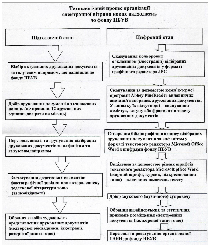
Блок-схема № 1. Технологічний процес організації електронної вітрини нових надходжень до фонду НБУВ

Узагальнюючи основні властивості ЕВНН до фонду НБУВ, можна констатувати, що: