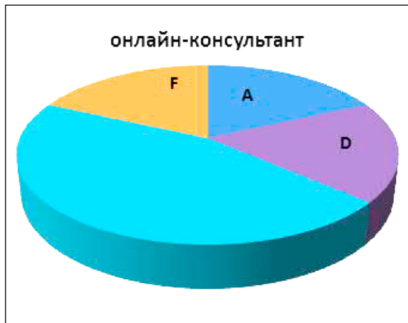
Рис. 7. Вебсайти наукових бібліотек класичних університетів України, устатковані сервісом онлайн-консультант

На вебсайті бібліотеки Криворізького національного університету діє дотична онлайн-послуга – «Вибіркове розповсюдження інформації».