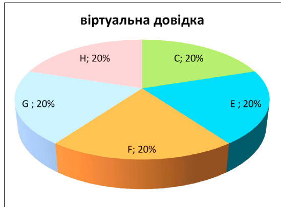
Рис. 3. Надання науковими бібліотеками класичних університетів України послуги віртуальної довідкової служби

Науковою бібліотекою Львівського національного університету імені Івана Франка віддалено надається доступ до наукометричних баз даних Web of Science, Scopus. Користувачі можуть також дистанційно скористатися електронним каталогом. Розроблена мобільна версія електронного каталогу.