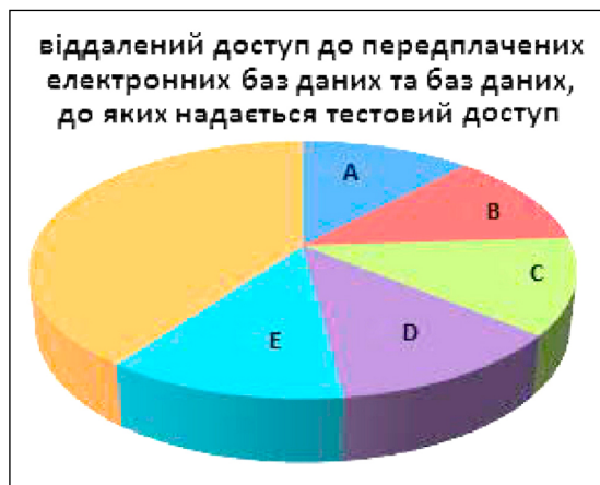
Рис. 4. Надання науковими бібліотеками класичних університетів України віддаленого доступу до передплатених електронних баз даних та баз даних, до яких надається тестовий доступ