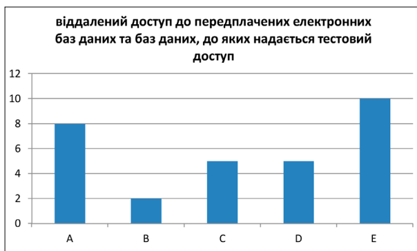
Рис. 5. Кількісне порівняння передплатених електронних баз даних та баз даних, до яких надається тестовий доступ поза межами бібліотек

Якщо ж порівнювати за кількістю передплатених електронних баз даних та баз даних, до яких надається тестовий доступ поза межами бібліотек (рис. 5), то переважає Центральна наукова бібліотека Харківського національного університету ім. В. Н. Каразіна, на другому місці – наукова бібліотека Національного університету «Києво-Могилянська академія».