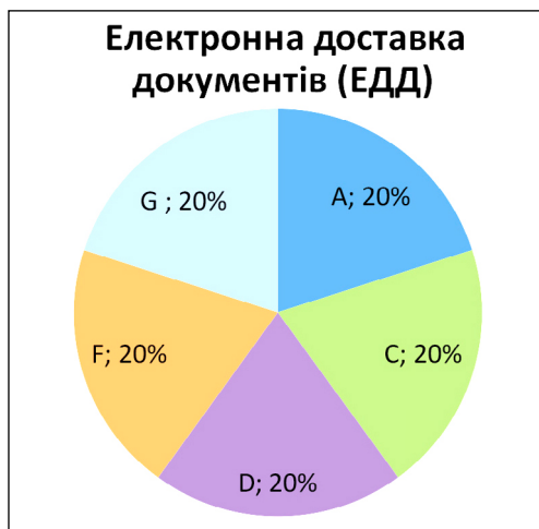
Рис. 2. Послуга електронної доставки документів

Так, щоб скористатися цією послугою, користувачеві наукової бібліотеки Національного університету «Києво-Могилянська академія» необхідно заповнити відповідну форму, зазначивши джерела та необхідний діапазон сторінок, і після цього на електронну скриньку надійде сканований фрагмент документа. Наукова бібліотека Прикарпатського національного університету ім. Василя Стефаника надає можливість отримати електронну версію документів після оформлення запити через Google форму.