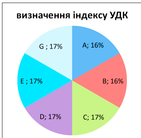
Рис. 1. Послуга із визначення індексів УДК науковими бібліотеками класичних університетів України

Послугу електронної доставки документів надають п'ять бібліотек із восьми бібліотек (рис. 2).