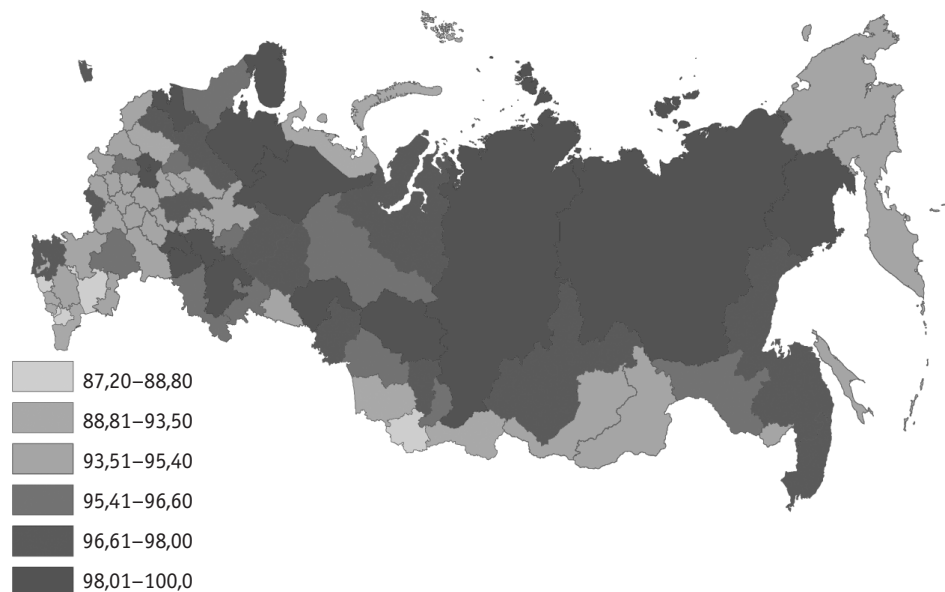
Рис. 1. Индекс первичной (индустриальной) модернизации в регионах России, 2010

дит в контексте ценностной трансформации постсоветского общества, характеризующегося ростом уровня различных негативных явлений как социального (аномия, криминализация общества [Кривошеев, 2004: с. 93–97]), так и психологического характера (когнитивная дезориентация, социальный пессимизм, отчуждение, депривация и проч. 1 ).