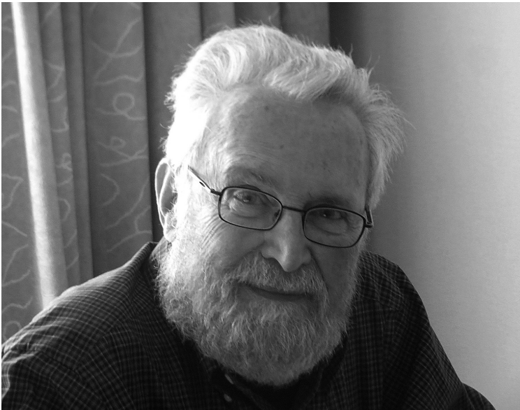
Мелвин Кон, 2013