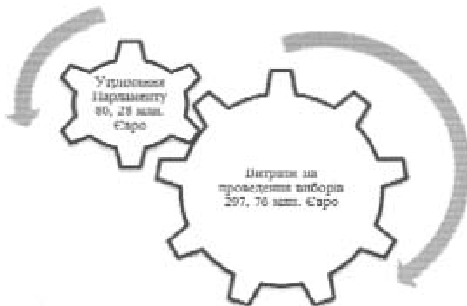
Мал. 2. Фінансування на утримання Парламенту Європейського співтовариства та витрат на проведення виборів 4 .