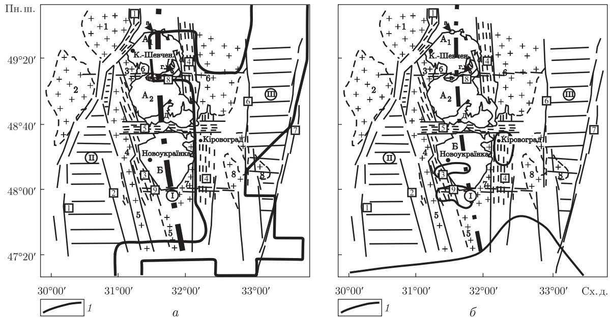
Рис. 3. Розподіл аномалій електропровідності в земній корі та верхній мантії 3D моделі Інгільського мегаблока.

Параметри аномалій: a — \rho = 10 \text{ Ом} \cdot \text{м} на глибинах 25–30 км (1); б — \rho = 10 \text{ Ом} \cdot \text{м} на глибинах 50–120 км (1)