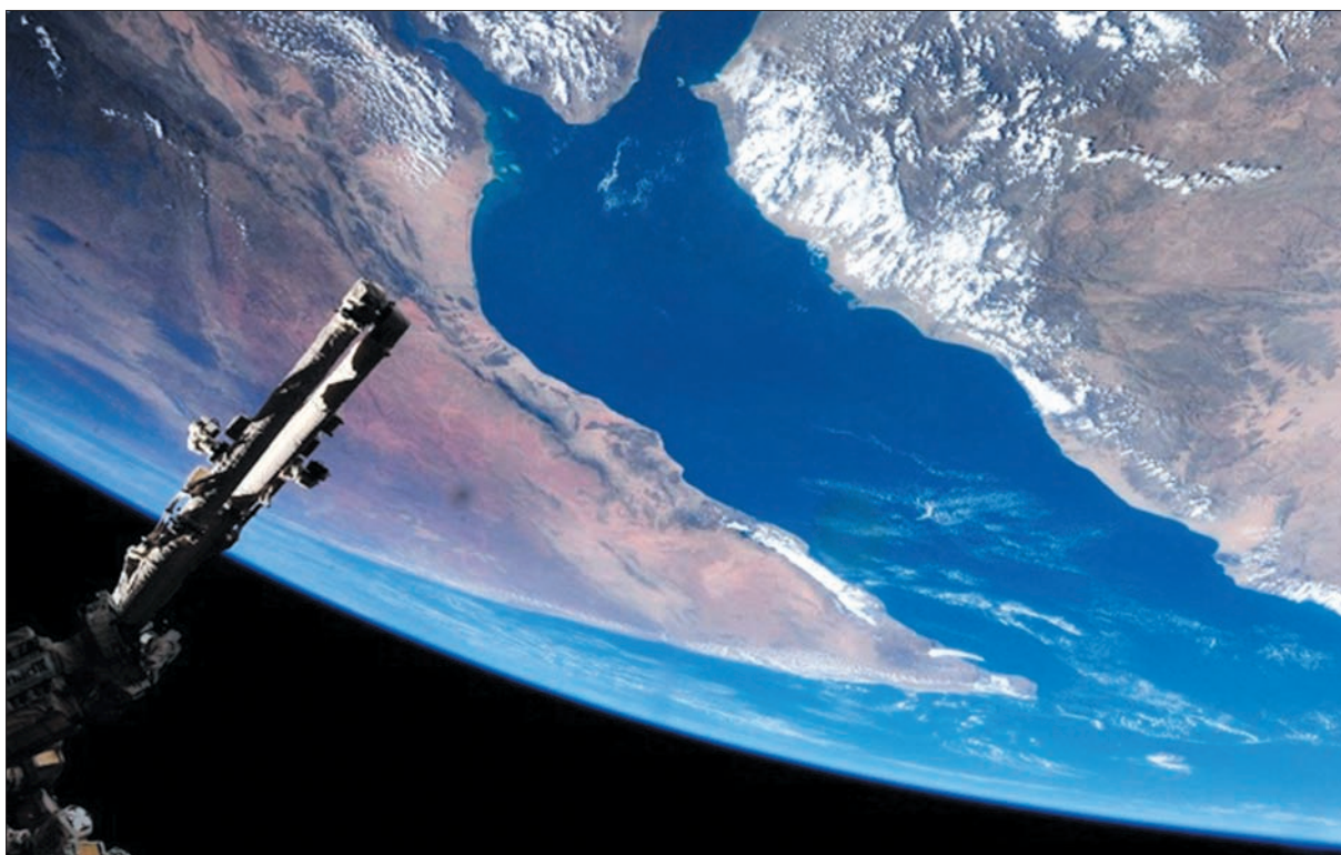
Рис. 2. Линейные облачные аномалии в районе Египта, Суэцкого залива, Южного Синая и Саудовской Аравии. Снимок выполнен с борта Международной космической станции в августе 2016 г. с высоты 350 км из итальянского обзорного модуля “Купол”