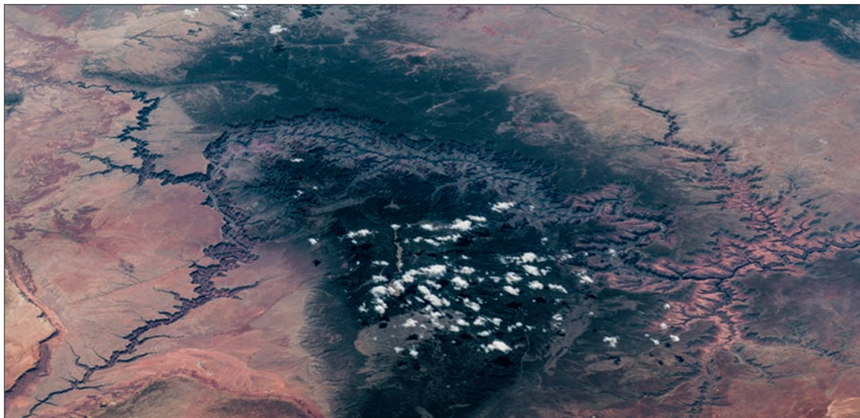
Рис. 1. Линейные цепочки облаков над фрагментами активизированных глубинных разломов в аризонской пустыне, США. Снимок выполнен с борта Международной космической станции в августе 2016 г. с высоты 350 км из итальянского обзорного модуля “Купол”.