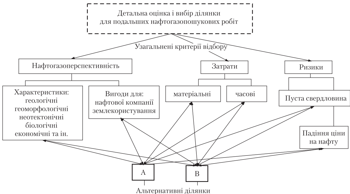
Рис. 3. Модель детальної оцінки і вибору ділянок території для нафтогазоперспективних робіт

На підставі отриманих значень функції F для кожної із 139 ділянок з використанням програми ArcGIS 10.0 було побудовано схему нафтогазоперспективності ділянок Турутинсько-Рогінцівської зони структур ДДЗ (див. рис. 2).