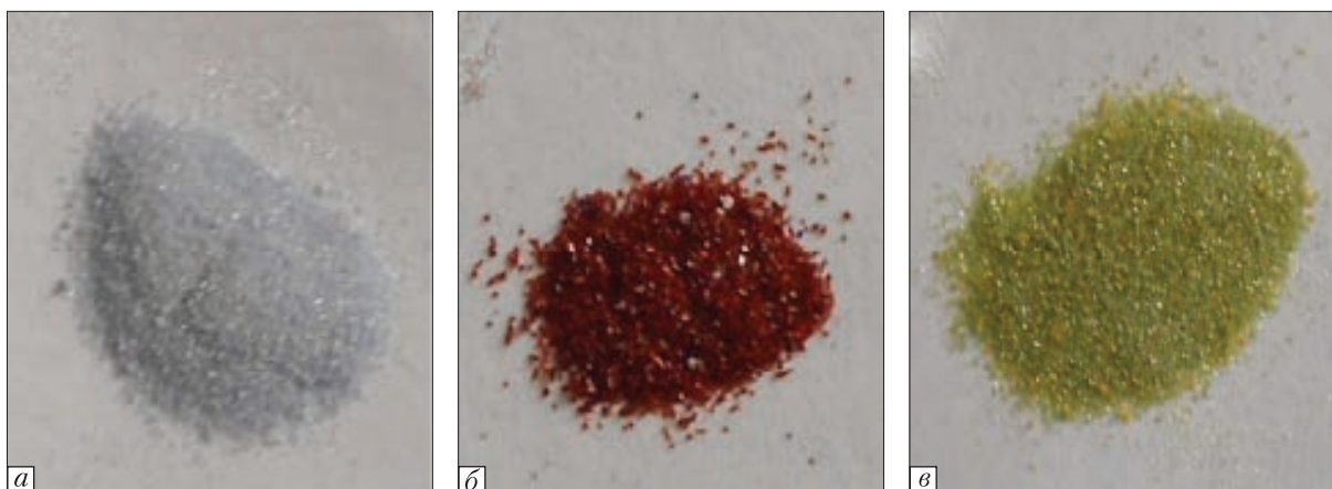
Рис. 1. Монокристали синтезованих фосфатів (\text{K/Rb})_2M^{II}_{0,5}\text{Ti}_{1,5}(\text{PO}_4)_3 ( M^{II} – Mg (а), Co (б), Ni (в))

відних для чистого \text{NaTi}_2(\text{PO}_4)_3 з роботи [10], що у сукупності із забарвленням кристалів свідчить про лише легування кристалів \text{NaTi}_2(\text{PO}_4)_3 іонами двовалентних металів. Отже, для даних систем слід відзначити, що присутність незначної кількості катіонів рубідію ( \text{Na/Rb} = 2,0 ) у розчин-розплаві практично не впливає на кристалоутворення фази \text{NaTi}_2(\text{PO}_4)_3 і не сприяє частковому заміщенню \text{Ti} \rightarrow M^{II} у структурі фосфату.