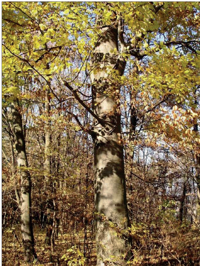
Рис. 3. Бук лісовий ( Fagus sylvatica ) у Северинівському парку (Вінницька обл.)

са) бук не був широкопоширений. Тому східні слов'яни не мали у своїй мові слова для позначення букового дерева, а запозичили його у стародавніх германців від давньогерманського слова “ bocus ” [7].