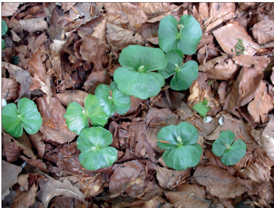
Рис. 4. Сходи бука лісового ( Fagus sylvatica )

умовах лісостепу України поверхневі шари різних типів лісових ґрунтів навіть після нетривалих посух втрачають вологу. В червні—липні спостерігається найбільш інтенсивна втрата вологи, з чим пов'язана масова елімінація букових сходів у лісових культурфітоценозах.