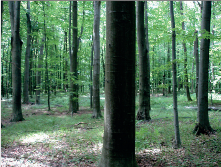
Рис. 2. Буковий ліс у Сатанівському лісництві (Хмельницька обл.)

Ж. Fydakowski та W. Szafer [1, 8] вважали, що букові ліси Верхньогоринської рівнини є природними за походженням. С.В. Шевченко [9] заперечував цю точку зору і відносив їх до лісових культур. Аналіз ценопопуляцій бука в цих місцезростаннях показав [7], що вони відзначаються повностановими спектрами онтогенетичних станів і різновіковою структурою, що вказує на природне походження та довготривале існування острівних букових лісів Верхньогоринської рівнини.