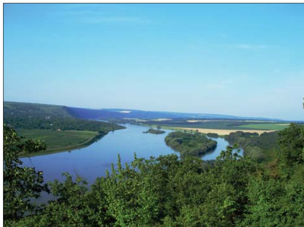
Рис. 1. Ландшафтна екосистема долини р. Дністер (Вінницька область)