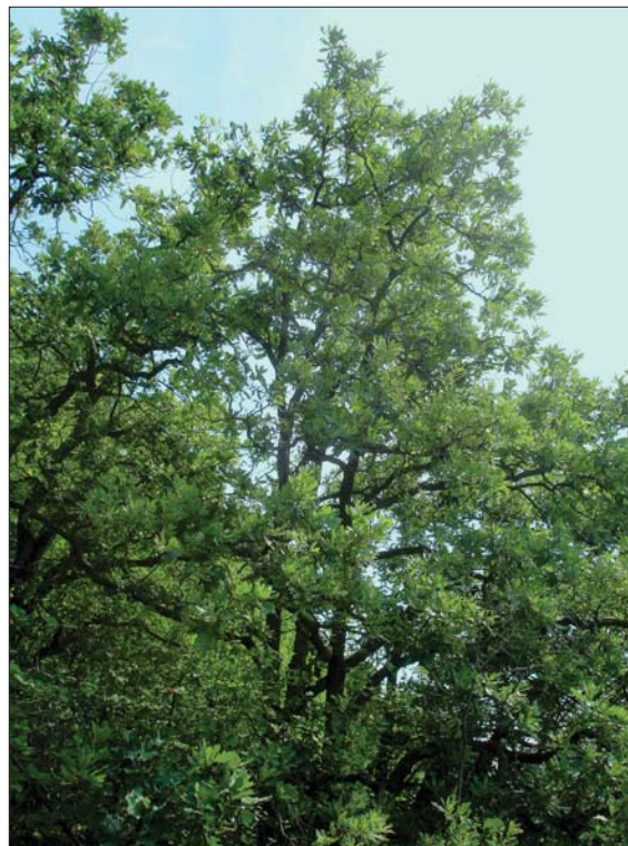
Рис. 2. Дерева дуба пухнастого ( Quercus pubescens Willd.) (Вінницька область)

Tan, Anthericum ramosum L., Asparagus tenuifolius Lam., Cynanchica pyrenaica (L.) P. Caputo & Del Guacchio, Brachypodium pinnatum (L.) P. Beauv., Campanula persicifolia , Campanula rapunculoides L., Caragana frutex (L.) K. Koch, Carex digitata L., Carlina vulgaris L., Chamaecytisus austriacus , Krascheninnikovia ceratoides (L.) Gueldenst., Ephedra distachya L., Euphorbia amygdaloides L., Galium verum L., Iris hungarica Waldst. & Kit., Melampyrum arvense L., Melica transsilvanica Schur, Pilosella echioides (Lum.) F. W. Schultz & Sch. Bip., Poa nemoralis L., Polygala comosa Schkuhr, Potentilla recta L., Tanacetum corymbosum , Hylotelephium maximum (L.) Holub, Teucrium chamaedrys , Vinca herbacea , Vincetoxicum hirundinaria Medik., Viola odorata L.