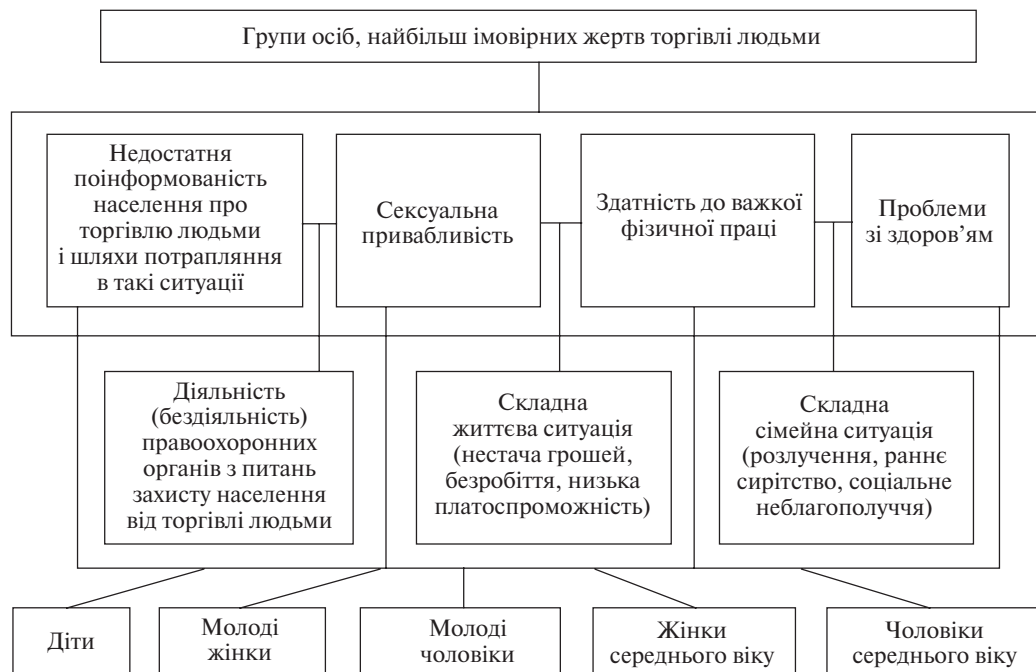
Рис. 2. Декомпозиція проблеми оцінки вибору груп ризику, які найвірогідніше можуть стати жертвами торгівлі людьми