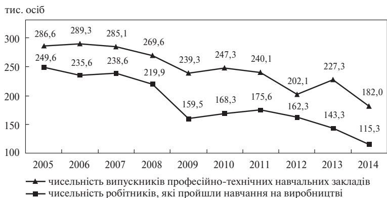
Рис. 3. Підготовка робітничих кадрів в Україні (2005–2014 рр)