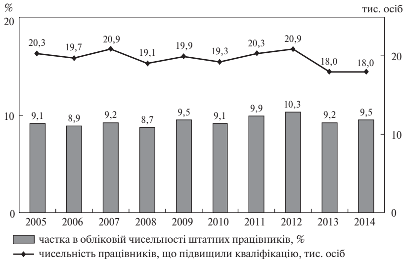
Рис. 5. Підвищення кваліфікації працівників на виробництві та у навчальних закладах Кіровоградської області (2005–2014 рр.)

Джерело: укладено автором за даними [6; 11].