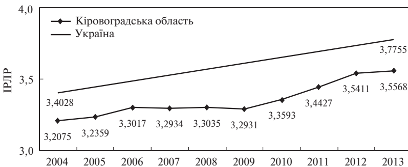
Рис. 2. Динаміка індексу регіонального людського розвитку (2004–2013 рр.)

Протягом 2005–2014 рр. найбільша частка осіб (у 2014 р. – 85,5 %) пройшли навчання новим професіям саме на виробництві. Таке виробниче навчання забезпечує рівень професійної компетентності нових працівників, що найбільш повно відповідає вимогам робочого місця та очікуванням роботодавців. При цьому обсяги підвищення кваліфікації на підприємствах, в установах, організаціях мають сталу тенденцію до зниження.