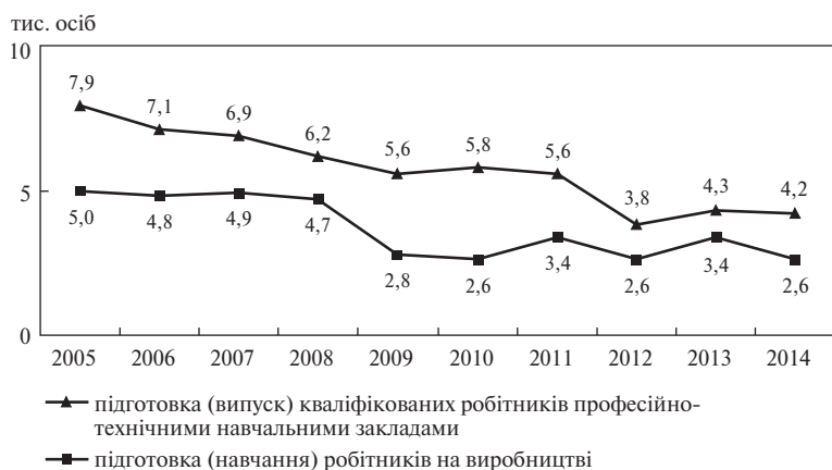
Рис. 4. Динаміка підготовки кваліфікованих робітників у Кіровоградській області (2005–2014 рр.)