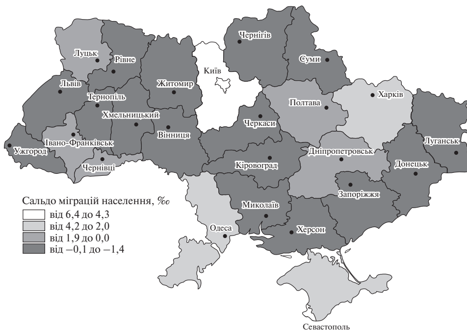
Рис. 1. Середні показники сальдо міграцій населення України в регіональному розрізі у 2010–2013 роках